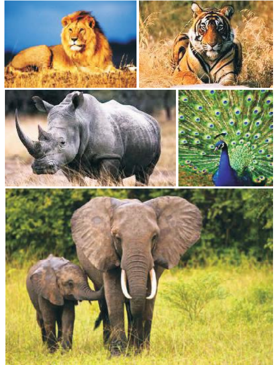
चित्र 12.2 वन्य जीव

सामान्य अर्थ में वन्यजीव उन जीव-जन्तुओं के लिए प्रयुक्त होता है जो प्राकृतिक आवास में निवास करते हैं जैसे हाथी, शेर, गैंडा, हिरण आदि। किन्तु व्यापक रूप से 'वन्य जीव' प्रकृति में पाए जाने वाले सभी जीवजन्तुओं एवं पेड़-पौधों की जातियों के लिए प्रयुक्त किया जाता है। भारतवर्ष एक ऐसा देश है जो धार्मिक, सांस्कृतिक, राजनैतिक, जलवायु, भूमि एवं जैव विविधता से सम्पन्न है। उल्लेखनीय है कि हमारे देश की भूमि का क्षेत्रफल संसार की भूमि के क्षेत्रफल का मात्र 2.4 प्रतिशत है जबकि विश्व की कुल जैव विविधता में से 8.1 प्रतिशत जातियाँ हमारे देश में पायी जाती हैं। भारत में कुल मिलाकर स्तनधारियों की 500, पक्षियों की 1200, सर्पों की 220, छिपकलियों की 150, कछुओं की 30, मगर एवं घड़ियाल की 30 उभयचरों की 142, अलवणीय जल की मछलियों की 105, एवं अकशेरुकी जन्तुओं की हजारों जातिया पायी जाती हैं।