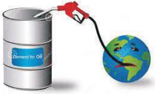
चित्र 12.10— पेट्रोलियम

पेट्रोलियम एक अत्यधिक उपयोगी पदार्थ है जिसका उपयोग दैनिक जीवन में बहुत अधिक होता है। कोयले की भांति पेट्रोलियम भी एक जीवाश्म ईंधन है। इसका निर्माण भी कोयले की तरह ही वनस्पतियों एवं जीव जन्तुओं के पृथ्वी के नीचे दबने तथा कालान्तर में उनके ऊपर उच्च दाब तथा ताप के आपतन के कारण हुआ। प्राकृतिक रूप में पाये जाने वाले पेट्रोलियम को अपरिष्कृत तेल, कच्चा तेल, चट्टानों का तेल आदि कहा जाता है। जो काले रंग का गाढा द्रव होता है इसमें विभिन्न अवयव पाये जाते हैं।