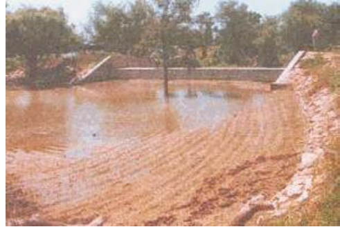
चित्र 12.4 खड़ीन

1) खड़ीन :- खड़ीन मिट्टी का बना अस्थायी तालाब होता है जिसे किसी ढालवाली भूमि के नीचे निर्मित करते हैं इसके दो तरफ मिट्टी की दीवार (धोरा) तथा तीसरी तरफ पत्थर की मजबूत दीवार होती है। पानी की मात्रा अधिक होने पर खड़ीन भर जाता है और पानी अगली खड़ीन में चला जाता है जब खड़ीन का पानी सूख जाता है तो उसमें कृषि की जाती है।