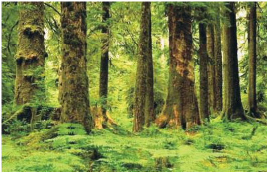
चित्र 12.1 वन

वन इस पृथ्वी पर जीवन का आधार है। यह वह क्षेत्र है जहां जीवन के विकास की क्रिया युगों से चलती आयी है और प्राणियों तथा पौधों की लाखों जातियों की उत्पत्ति हुई है। वन, बरसात तथा उसमें पानी के संरक्षण हेतु अलवणीय जल के स्रोतों तथा नदियों के वर्षा-जल के निरन्तर पूर्ति के नियंत्रक होने के साथ-साथ जलवायु के लिए वायुमण्डल को आर्द्रता की पूर्ति भी करते हैं।