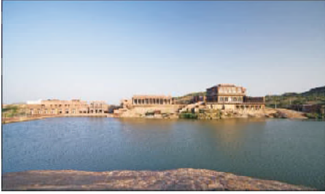
चित्र 12.6- कायलाना झील (जोधपुर)

3) झील :- राजस्थान में प्राकृतिक एवं कृत्रिम दोनों प्रकार की झीलें पायी जाती हैं। झीलें वर्षाजल संग्रहण की अति प्राचीन पद्धति है। झीलो से रिसने वाला पानी इस के नीचे स्थित जल स्रोतों जैसे कुएँ, बावड़ी, कुण्ड आदि का जलस्तर बढ़ाने में सहायक होता है।