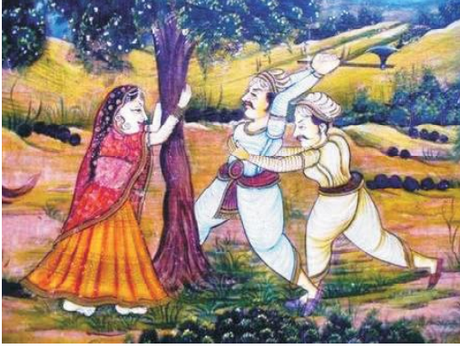
चित्र 12.11— अमृता देवी (चिपको आन्दोलन)

गांव से हुई जहां अमृता देवी के साथ 363 बिश्नोई स्त्री, पुरुष एवं बच्चों ने अपना बलिदान दिया।