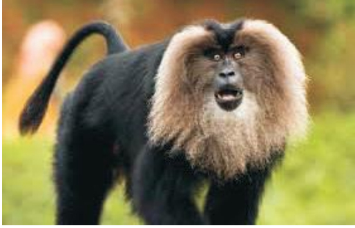
मैकाक बंदर (Lion-tailed macaque)

ऐसी प्रजातियाँ जो एक क्षेत्र विशेष में पाई जाती हैं अर्थात् जिनका वितरण या विस्तार एक सीमित क्षेत्र में होता है स्थानबद्ध (Endemic) प्रजातियाँ कहलाती हैं। उदाहरणार्थ—लेमूर (Lemur) प्राणी मात्र मेडागास्कर द्वीप तक सीमित है। इसी प्रकार मेटासीकोया पादप केवल चीन की एक घाटी में मिलता है। नीलगिरी थार (Nilgiri Thar) तथा मैकाक बंदर (Lion-tailed macaque) भारत के पश्चिमी घाट में ही पाए जाते हैं। अतः किसी स्थान की स्थानबद्धता का यह आशय हुआ कि वहाँ पाई जाने वाली प्रजातियाँ विश्व में अन्य कहीं नहीं पाई जाती।