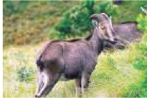
नीलगिरी थार (Nilgiri Thar)

किसी प्रजाति की स्थानबद्धता का मुख्य कारण उस क्षेत्र की जलवायु, भौगोलिक परिस्थितियाँ तथा अन्य प्रजातियों के साथ पारस्परिक संबंध होता है। स्थानबद्ध प्रजातियों के सीमित विस्तार के कारण उनके विलुप्त या संकटग्रस्त होने की संभावना अधिक होती है। अतः इनके संरक्षण पर विशेष ध्यान दिए जाने की आवश्यकता होती है। “डोडो” पक्षी जो मॉरिशस के एक द्वीप की स्थानबद्ध प्रजाति थी, की खोज सर्वप्रथम वर्ष 1658 में हुई थी। किन्तु उस द्वीप पर मानव गतिविधियों के बढ़ने व शिकार के कारण यह पक्षी मात्र 23 वर्षों में विलुप्त हो गया। वर्ष 1681 में इसे अन्तिम बार देखा गया था।