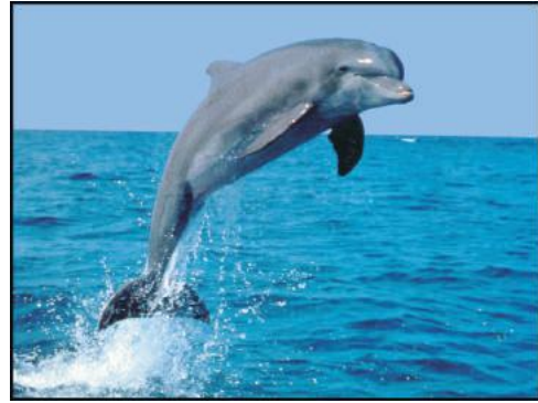
चित्र 19.3 गांगेय डॉल्फिन

जिनमें 12 प्रजातियाँ स्थानबद्ध है, 997 प्रजातियाँ पक्षियों की हैं जिनमें 15 प्रजातियाँ स्थानबद्ध है, 176 प्रजातियाँ सरिसृपों की हैं जिनमें 15 प्रजातियाँ स्थानबद्ध है, 105 प्रजातियाँ उभयचरों की हैं जिनमें 40 प्रजातियाँ स्थानबद्ध है, 269 प्रजातियाँ मछलियों की हैं जिनमें 33 प्रजातियाँ स्थानबद्ध है, पाई जाती है। इस क्षेत्र में पाए जाने वाले कुछ प्रमुख जीवों के नाम है— हिमालयी तहर (Himalayan Tahr), सुनहरा लंगूर (Golden Langur), हुलोक गिबबन (Hoolock Gibbon), पिग्मी हॉग (Pygmy hog), उड़न गिलहरी (Flying Squirrel), हिम तेंदुआ (Snow leopard), ताकिन (Takin), गांगेय डॉल्फिन (Gangetic Dolphin) आदि।