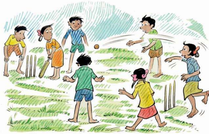
चित्र-5.10 : क्रिकेट के खेलते हुए बच्चे

क्रिकेट का खेल एक अच्छा उदाहरण है जिसके द्वारा बल का प्रयोग एवं इसका गति पर प्रभाव को दिखलाया जा सकता है। जब गेंद गेंदबाज के हाथ में होती है तो वह विराम में होती है। जब वह गेंदबाजी करता है तब गेंद गति में आ जाती है। बल्लेबाज द्वारा गेंद पर प्रहार करने से गेंद की गति धीमी या तेज हो जाती है। क्षेत्ररक्षक के द्वारा गतिशील गेंद को रोककर उसे फिर विराम की अवस्था में पहुँचा दिया जाता है। उपर्युक्त सभी क्रियाओं में बल का उपयोग होता है।