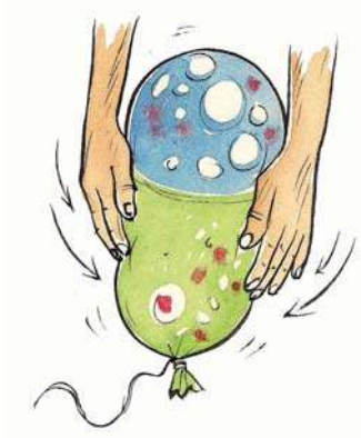
चित्र-5.9 : हवा भरा हुआ बैलून