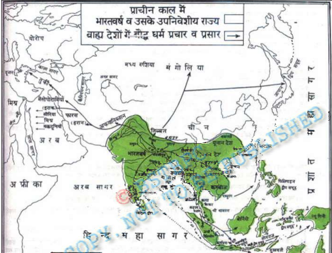
दक्षिण पूर्व एशियाई देशों का मानचित्र

और मध्य एशिया में भी बौद्धधर्म का बड़े पैमाने पर प्रचार हुआ। गौतम बुद्ध की सबसे विशाल मूर्ति अफगानिस्तान के वामयान में ही पहाड़ को काटकर बनायी गयी थी।