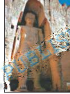
वामियान स्थित भगवान बुद्ध

शुंग शैली : शुंग कला में स्तूप के चारों ओर एक ऊँची चहारदीवारी बनायी जाती थी तथा चार तोरण द्वार लगाए जाते थे जिसको जातक कथाओं बौद्ध चिहनों, नाग एवं अप्सरा की मूर्तियों से सजाया जाता था। भारहुत और सांची का स्तूप इस कला का उदाहरण है।