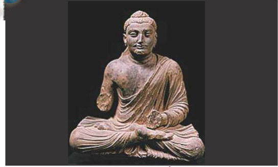
बुद्ध (गांधार शैली)

गांधार शैली : यूनानी कला के प्रभाव से देश के पश्चिमोत्तर प्रदेशों में गांधार शैली का विकास हुआ। इस शैली की अधिकांश मूर्तियां बुद्ध के जीवन यात्रा से सम्बन्धित हैं। गांधार कला की अनेक मूर्तियां लाहौर तथा पेशावर के संग्रहालयों में सुरक्षित हैं। भारत के बाहर इस कला का व्यापक प्रभाव रहा। इस शैली को 'इण्डो-ग्रीक शैली' भी कहा जाता है।