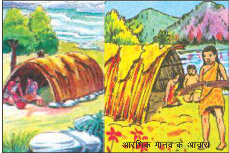
आरंभिक मानव के आवास

चूँकि फसल तैयार होने में 4-6 महीने लग जाते थे। इस प्रक्रिया में समूह के सभी लोग आपस में सहयोग करते थे। इस सहयोग से उनके बीच नाता-रिश्ता जिसका आधार आपसी संबंध था शुरू हुआ। स्थायी रूप से एक जगह रह कर फसलों को उपजाने के कारण लोग अब छप्पर वाली झोपड़ियों का बनाना शुरू किये। अनाज के भंडार को रखने के लिए उन्होंने मिट्टी के बर्तनों को बनाना आरंभ किया। धीरे-धीरे कताई-बुनाई शुरू हुई। मिट्टी के बर्तनों का इस्तेमाल वे लोग भोजन बनाने एवं खाना खाने में भी करने लगे। शिकारी मानव के जीवन में ये सारे बदलाव हजारों वर्ष में संभव हो सकता था।