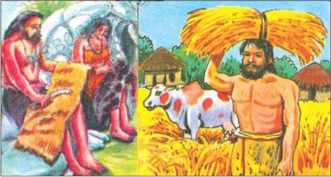
आरंभिक मानव के साथ पालतू पशु

जिस समय खेती की शुरुआत हुई लगभग उसी समय पशुपालन भी शुरू हुआ। पशु पालने का काम वस्तुतः शिकारी संग्रहकर्ताओं ने ही पहले किया था। शुरू में जब वे लोग जानवरों का शिकार करते होंगे तो उन्हें पशुओं के बच्चे भी हाथ लग जाते थे। उसे वे पकड़ कर अपने रहने के ठिकाने पर लाते होंगे ताकि बड़े होने पर उससे ज्यादा मांस प्राप्त हो सके। इस तरह आरंभिक मानव भेड़ों—बकरियों के नन्हे मेमनों को एवं नन्हे बछड़ों एवं बाछियों को अपने पास बांध कर रखने लगे। धीरे—धीरे उन्हें उन जानवरों की उपयोगिता समझ आई होगी। उन्हें यह लगा होगा कि जानवरों को मार कर खा लेने की बजाए यदि जिन्दा पाला जाए तो बहुत से नए फायदे मिल सकते हैं। आरंभिक मानव ने पशुओं को पालतू बनाते समय कुछ बातों का ध्यान अवश्य रखा होगा। जैसे— ऐसे पशु को पालतू बनाया जाए जिनके लिए आसानी से भोजन उपलब्ध कराया जा सके। वह हिंसक न हो तथा नुकसान न पहुँचाए उन्हें अपने साथ इधर—उधर भी ले जाया जा सके साथ ही शिकार खोजने एवं भोजन ढूँढ़ने में उनसे मदद भी मिले। यही सब बातें सोचकर उसने सबसे पहले कुत्ता, फिर सुअर, भेड़, बकरी और अन्य जानवरों को पालना शुरू किया।