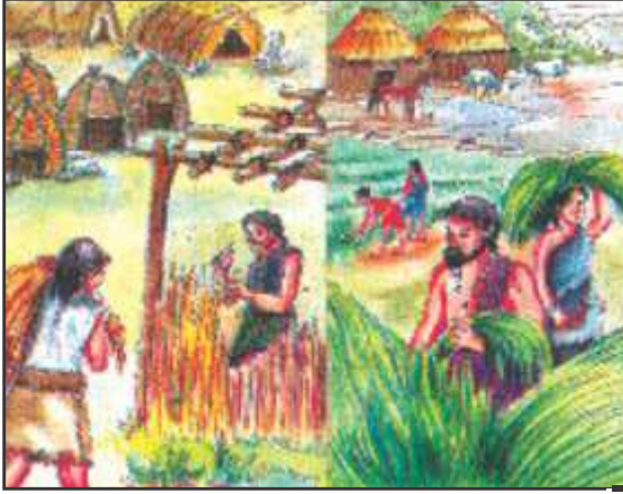
आरंभिक मानव द्वारा कृषि कार्य

कर सकते थे। इसी के साथ उनकी जीवनशैली में बदलाव आया शिकार करने वाले और फल, अनाज इकट्ठा करने वाले लोग अपना निवास क्षेत्र बदलते रहते थे। मगर अब फसल की रखवाली के लिए खेतों के आस पास स्थाई रूप में रहना आवश्यक हो गया इस तरह आरंभिक गाँव बसे।