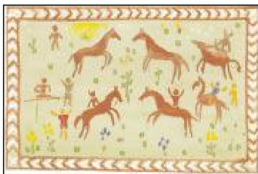
पिठौरा शैली का चित्र

का शरीर पर स्थायी अंकन करवा लेने की प्रथा लोकप्रिय है। इस अंकन को 'गुदना' कहा जाता है। जनजातियों के लोगों का विश्वास होता है कि गुदना उनके जीवन भर के आभूषण हैं।