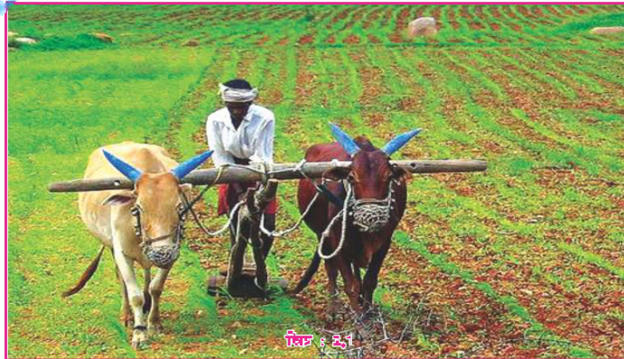
चित्र 2.1 : धान की बुआई के लिए खेत को तैयार कर रहा किसान

“खेती करना जिसे हम कृषि कार्य कहते हैं, एक प्राथमिक क्रिया है। हमारे देश की 60% जनसंख्या कृषि कार्य से ही जीविका पाती है। भूमि को जोतकर विभिन्न प्रकार की फसलें, सब्जियाँ, फल-फूल उपजाना, पशुओं को पालना, मत्स्य पालन इत्यादि करना कृषि कार्य हैं। कृषि उत्पादों पर दूसरे अनेक उद्योग निर्भर करते हैं। खेती करना एक तंत्र की तरह है। इसमें बीज, सिंचाई, खाद, उपकरण व श्रमिक लगते हैं। जुलाई-बुआई, निरुई, कटाई चरणबद्ध प्रक्रियाएँ की जाती हैं तब जाकर अन्तिम उत्पाद के रूप में हमें अनाज, दलहन, फल-सब्जी, ऊन, डेयरी उत्पाद-दुग्ध, माँस इत्यादि प्राप्त होते हैं। कृषि करने की विधियाँ एवं तकनीक प्रत्येक भौगोलिक क्षेत्र में अलग-अलग प्रकार की होती हैं।