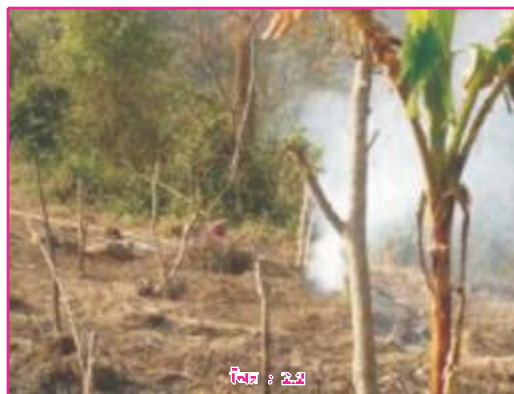
चित्र : 2.2

इस तरह से चो जाने वाली खेती में मुख्य रूप से चावल और मक्के की फसल उगाई जाती है। बिहार में इस प्रकार की खेती के प्रमाण नहीं मिलते हैं। बच्चे बड़ी उत्सुकता से देख और सुन रहे थे। इसी बीच किसानों का एक दल भी आकर सभागार में बैठ गया था। वे भी वृत्त चित्र देखने लगे। पर्दे पर दृश्य बदल गये थे। भीड़भाड़ वाले ग्रामीण और शहरी क्षेत्र दिखाई दे रहे थे। लम्बे बड़े मैदानों में धान के खेतों में काम करते हुए लोग दिखाई दे रहे थे। इसी दृश्य के साथ आवाज गूँजी, भारत के उन क्षेत्रों में जहाँ भूमि पर जनसंख्या का दबाव अधिक होता है वहाँ गहन जीविका कृषि की जाती है। इस प्रवृत्ति ने कम से कम भूमि में अधिकतम उत्पादन का पयास किया जाता है। इसके लिए श्रम, उर्वरक और उपकरणों का भरपूर प्रयोग किया जाता है और एक वर्ष में एक ही खेत में अनेक फसलें उगाई जाती हैं। इसे 'गहन कृषि' भी कहते हैं। बिहार में इसी प्रकार की खेती होती है। पर्दे पर बिहार का