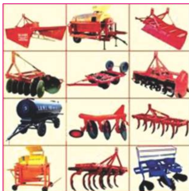
चित्र 2.4 : आधुनिक कृषि उपकरणों

राज्य में कृषि जीवन निर्वाह के लिए किया जाता है। जनसंख्या का अत्यधिक बोझ, रोजगार के अन्य साधनों के आभाव से कृषि ही अर्थ प्राप्ति का स्रोत होता है। यहाँ कृषि का स्वरूप व्यवसायिक नहीं हो गया है। लेकिन वर्तमान में बिहार में कृषि के क्षेत्र में ट्रैक्टर, पवर टोल्न,