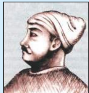
चित्र 8 – मीर कासिम

‘कलकत्ते से ढाका, कासिम बाजार और पटना तक प्रत्येक स्थान पर प्रत्येक अंग्रेज अधिकारी, उसके गुमाश्ते तथा एजेंट मेरे कर्मचारियों के स्थान पर स्वयं जमींदार, तालुकेदार और लगान वसूल करनेवाले का कार्य करते हैं। इसके अतिरिक्त प्रत्येक जिले, नगर और गांव में गुमाश्ते और अन्य कर्मचारी चावल, धान, तेल, बांस, पान आदि का व्यापार करते हैं और कंपनी की दस्तक लिए हुए प्रत्येक व्यक्ति अपने आपको कंपनी से कम नहीं समझता है।’