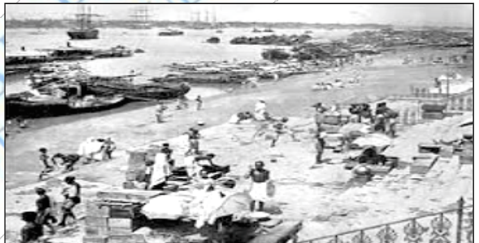
चित्र 2 - हुगली नदी के किनारे अंग्रेजों की फैक्ट्री

कर्नाटक मुगल साम्राज्य का एक सूबा था जो लगभग स्वतंत्र हो चुका था। फ्रांसिसी कंपनी का मुख्य कार्यालय इनकी सीमा के काफी करीब था। सन 1740 के आस-पास