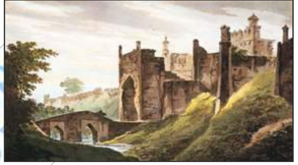
चित्र 9 – मुंगेर का किला

दस्तक:—दस्तक वह प्रमाण पत्र था जो अंग्रेजी फैक्ट्री का अध्यक्ष कंपनी के सामान के संबंध में देता था जिससे उस सामान के व्यापार पर चुंगी नहीं लगती थी।