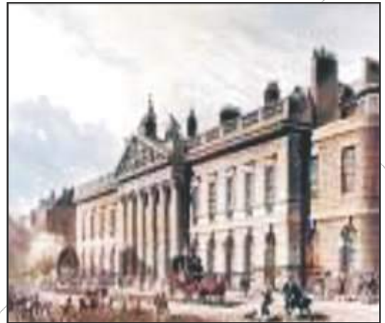
चित्र 5 – कासिम बाजार

इस पूरी व्यवस्था से बंगाल के राजस्व का काफी नुकसान हो रहा था। कंपनी को मिली इस छूट का फायदा कंपनी के कर्मचारी अपने निजी व्यापार के लिए भी कर रहे थे। बंगाल के नवाब सिराजुद्दौला को यह व्यवस्था पसंद नहीं आयी। उसने कंपनी को बिना शुल्क व्यापार करने से मना कर दिया। उसने कंपनी पर धोखाधड़ी का आरोप लगाते हुए उनकी किलेबंदी के विस्तार