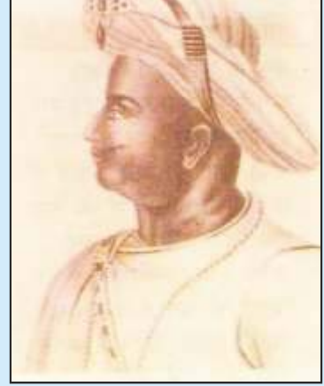
चित्र 12 - 'शेर-ए-मैसूर' टीपू सुलतान

राजाओं की छवि अक्सर जनश्रुतियों से भी बनती है। प्रचलित किस्सों में उनकी ताकत का खूब यशगान किया गया है। 1782 ई. में सुलतान बने टीपू के बारे में कहा जाता है कि एक बार वे अपने फ्रांसिसी दोस्त के साथ जंगल में शिकार खेलने गए थे। वहां एक शेर उनके सामने आ गया। उनकी बंदूक ने मौके पर साथ नहीं दिया और कटार भी जमीन पर गिर गई। फिर भी टीपू ने निहत्थे ही शेर का मुकाबला किया और आखिरकार कटार उठा ली अंत में उन्होंने शेर को मार गिराया। इसी के बाद से उन्हें 'शेर-ए-मैसूर' कहा जाने लगा