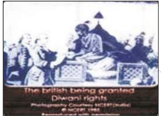
चित्र 10 – 1765 ई० में बंगाल की दीवानी प्राप्त करते

निःसंदेह मीर कासिम द्वारा उठाए गये इन कदमों से कंपनी के अफसर नाराज हो गए और उन्होंने नवाब को हटाने का फैसला किया। मीर कासिम ने महसूस किया कि वह अकेला कंपनी की फौज का सामना नहीं कर सकता है। इसलिए उसने मुगल शासक शाह आलम और अवध के नवाब शुजाउद्दौला से मदद मांगी। इन