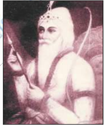
चित्र 14 - महाराजा रणजीत सिंह

कंपनी के अधिकारियों और फौज ने मराठा प्रमुखों की आपसी लड़ाइयों का फायदा उठाया और एक के बाद एक कई लड़ाइयों में मराठों को कमजोर कर दिया। अंततः 1817-19 के युद्ध में मराठे पूरी तरह पराजित हुए और मराठों का क्षेत्र भी कंपनी के प्रभावाधीन हो गया।