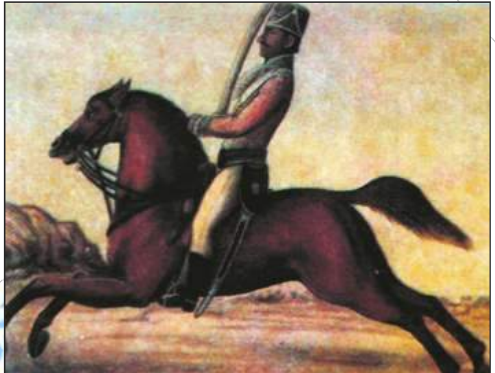
चित्र 11 – कंपनी के लिए काम करने वाला बंगाल का एक सवार, एक अज्ञात भारतीय चित्रकार द्वारा बनाया गया चित्र, 1780

इस तरह कंपनी के एक बहुत ही महत्वपूर्ण उद्देश्य की पूर्ति हो गई। अठारहवीं सदी की शुरुआत से ही भारत के साथ कंपनी का व्यापार बढ़ता जा रहा था। लेकिन उसे भारत से चीजें खरीदने के लिए अपने देश से लाए गए सोने और चांदी का ही इस्तेमाल करना पड़ता था। इससे इंग्लैंड में सोने और चांदी की कमी होने लगी थी एवं पूरे इंग्लैंड में इसका विरोध होने लगा था। यहां तक कि वहां की सरकार ने भी कंपनी को किसी और विकल्प की तलाश करने का आदेश दिया था। बंगाल की दीवानी हासिल करना कंपनी के लिए एक महत्वपूर्ण विकल्प के रूप में उभरा। इससे होने वाले मुनाफे से वे भारत से सामान खरीद कर इंग्लैंड भेज सकते थे और उन्हें चाँदी लाने की आवश्यकता नहीं रह गयी। इस तरह अब बगैर अपना कोई पैसा लगाये वे भारत के लोगों से ही पैसा वसूल कर भारत का ही सामान सस्ते में खरीद कर यूरोप भेज सकते थे और मुनाफा कमा सकते थे।