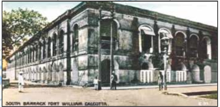
चित्र 4 – फोर्ट विलियम

धीरे-धीरे कम्पनी ने इस आबादी के चारों तरफ एक किला बनाना शुरू किया। इस किले का नाम फोर्ट विलियम रखा गया। कम्पनी ने अपने व्यापार को ज्यादा से ज्यादा विस्तार देने के लिए 1696 में 1200 रुपये का भुगतान करके