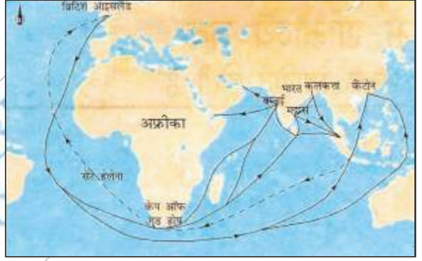
चित्र 1 – अठारहवीं सदी में भारत तक आने वाले रास्ते

स्थल मार्ग से यूरोप तक माल पहुँचाने में समय काफी अधिक लगता था और रास्ते में लुट जाने का भय सदा बना रहता था। बहुत से स्थानों पर उन्हें चूँगी (कर) भी देना पड़ता था। इसके अतिरिक्त अरब के व्यापारी समूह उनके लिए तमाम तरह की मुश्किलें खड़ी करते थे। इस लिए यूरोप के व्यापारियों के लिए यह आवश्यक हो गया था कि वे एशिया और भारत के लिए एक ऐसे रास्ते की खोज करें जिसमें ये सारी मुश्किलें न हों।