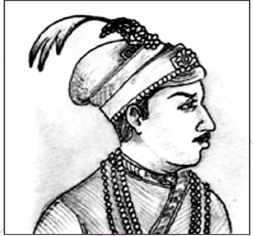
चित्र 3 – सिराजुद्दौला

अंग्रेज और बंगाल :- कर्नाटक के बाद संघर्ष का क्षेत्र दक्षिण से उत्तर पूर्व की ओर बंगाल में स्थानांतरित हो गया। बंगाल में अंग्रेजों ने कलकत्ता में अपनी फैक्ट्री स्थापित कर रखी थी। बंगाल मुगल साम्राज्य का एक धनी और बड़ा प्रांत था। इसमें आधुनिक बिहार और उड़ीसा भी शामिल थे। मुगलों की केन्द्रीय सत्ता की कमजोरियों का लाभ उठाते हुए बंगाल के दीवान मुर्शिद कुली खाँ ने अपने को एक स्वतंत्र शासक घोषित कर लिया था। वैसे वे मुगल बादशाह को नियमित रूप से राजस्व भेजते रहे। मुर्शिद कुली खाँ के बाद अलीवर्दी खाँ 1740 ई. में बंगाल का नवाब बना। उसने बंगाल में कुशल प्रशासन कायम किया। अलीवर्दी खाँ ने यूरोप के व्यापारियों को हमेशा अपने नियंत्रण में रखने का प्रयास किया। उसके बाद उसका नाती सिराजुद्दौला नवाब बना। सिराजुद्दौला के नवाब बनने पर उसके परिवार के सदस्यों के बीच साजिश और झगड़े शुरू हो गए। इन साजिशों ने ईस्ट इंडिया कंपनी को बंगाल में हस्तक्षेप करने का अवसर दिया।