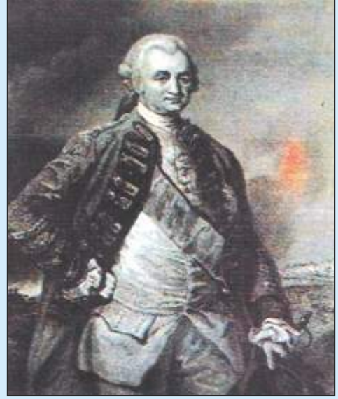
चित्र 7 - रॉबर्ट क्लाइव

फायदे हुए हैं। मुझे मालुम है कि इन सब बातों की तरफ एक हद तक अंग्रेज कौम का ध्यान आकर्षित हो चुका है, किन्तु मौका मिलने पर कंपनी इस तरह के प्रयत्नों में लगी रहेगी जो उसके आजकल के इतने बड़े इलाके और आगे की जबरदस्त सम्भावनाओं, दोनों के अनुरूप हो। मैंने कंपनी को अत्यन्त जोरदार शब्दों में इस बात की जरूरत दर्शा दी है कि उन्हें इतनी सेना हिन्दोस्तान भेज देनी चाहिए और बराबर हिन्दोस्तान में रखनी चाहिए, जिससे वह अपने उस समय के धन और इलाके को और बढ़ाने के सबसे पहले मौके से फायदा उठा सके। दो साल की मेहनत और तजुरबे से मैंने इस देश की हुकूमत के बारे में और यहाँ के लोगों के स्वभाव के बारे में जो परिपक्व ज्ञान प्राप्त किया है उससे मैं साहस के साथ कह सकता हूँ कि इस तरह का मौका जल्दी ही फिर आनेवाला है।