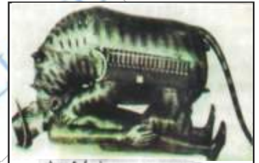
- टीपू का किल्ला को।

टीपू की मौत के बाद अंग्रजों ने मैसूर का शासन पुराने वोडियार राजवंश के हाथों में सौंप दिया। मैसूर राज्य के कुछ इलाके कंपनी ने हथिया लिया और वहां का नया राजा पूर्णतः कंपनी के अधीन हो गया।