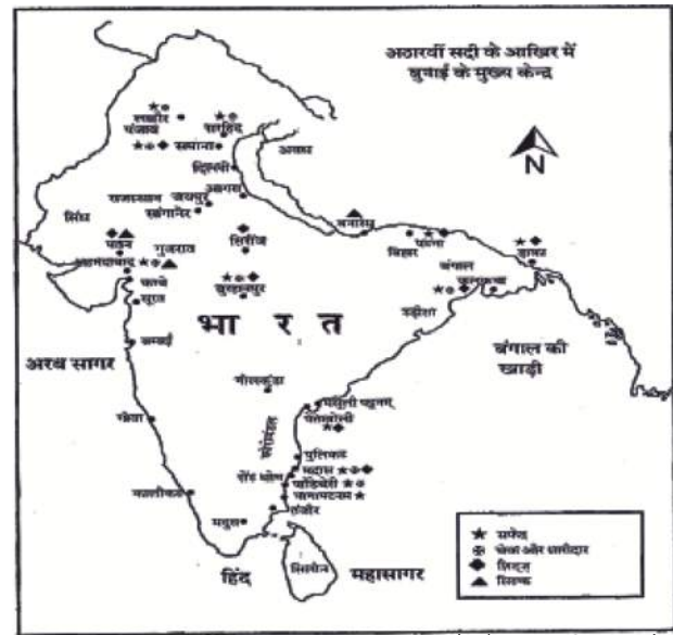
मानचित्र पैमाने पर आधरित नहीं है