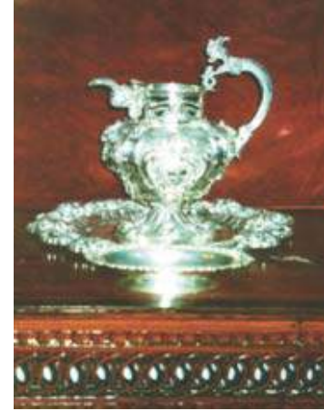
धातु की बनी वस्तु

अंग्रेजों के भारत आगमन से पहले हमारा राष्ट्रीय और अन्तर्राष्ट्रीय व्यापार बहुत समृद्ध था। भारत दूसरे देशों के साथ व्यापार ईसा से 2000 वर्ष पूर्व भी करता रहा है। मिश्र में 'मम्मीज' को भारतीय मलमल में लपेटकर रखा गया है, जो इस बात का सबूत है कि प्राचीन काल में मिश्र भारत से कपड़े का आयात करता था। यूनान में ढाका की मलमल 'गंगेतिका' नाम से बिकती थी। इसी तरह रोम में भी भारत में बनी चीजों की भारी खपत थी। मध्यपूर्व के देशों में रेशमी कपड़ों, जरी के काम, कीमती पत्थरों और धातु की बनी वस्तुओं की माँग सदैव रहती थी। चूँकि ये देश उस समय औद्योगिक दृष्टि से पिछड़े थे, इसलिए भारत उनसे आयात नहीं करता था। भारतीय व्यापारियों को निर्यात के बदले में अक्सर सोना और चाँदी मिलता था, जिसका अर्थ है कि सोने का देश के भीतर की ओर प्रवाह। देश की समृद्धि का यह मुख्य कारण बना। पहली सदी में 'प्लिनी' नामक लेखक ने शिकायत की थी कि भारतीय सामग्री के प्रयोग के कारण रोमन साम्राज्य से सोना बाहर की ओर खिंचता चला जा रहा है।