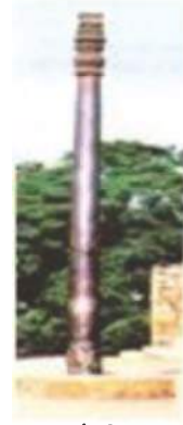
महरौली का लौह स्तम्भ