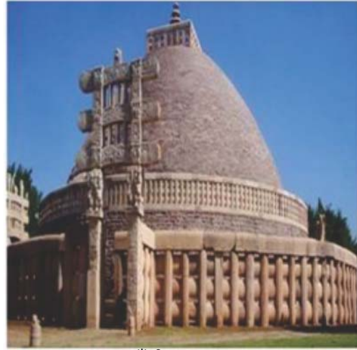
साँची का स्तूप

पूजा हेतु ठोस पाषाण स्तूपों का निर्माण किया गया। ऐसे पूजा स्थल को चैत्य कहा गया है। कुछ गुफाओं का इस्तेमाल भिक्षुओं के रहने के लिए भी होता था, ऐसी गुफाओं को विहार कहते हैं। विहार दो अथवा तीन मंजिला होते थे। विहार में ठहरने के अलावा भिक्षु पढ़ाई करते, ध्यान करते, अनेक विषयों पर विचार-विमर्श करते थे। इनके बारे में आप पिछले अध्याय में पढ़ चुके हैं। ये गुफाएँ कार्ले, भाजा, अजन्ता, ऐलोरा और कन्हेंरी में देखने को मिलती हैं। स्तूप, चैत्य और विहार की दीवारों को मूर्तियों व चित्रों से सुसज्जित किया गया है। इन मूर्तियों एवं चित्रों