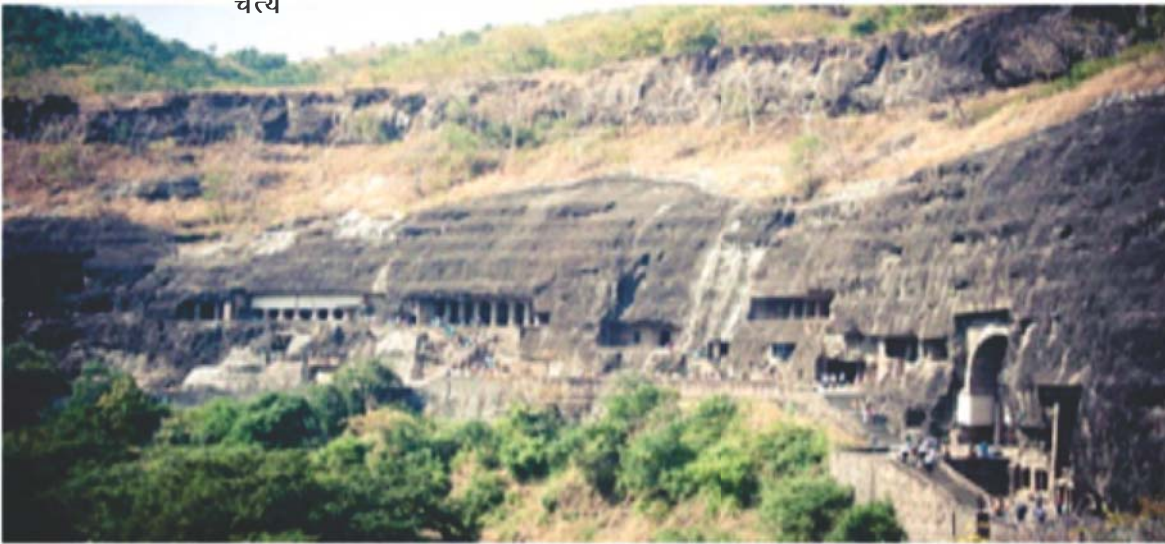
अजन्ता की गुफाओं का विहंगम दृश्य