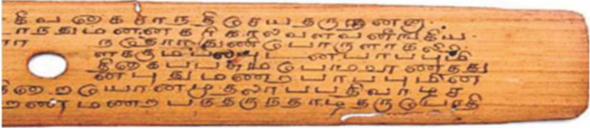
ताड़ पत्र पर लिखा तमिल साहित्य

आर्यभट्ट — आर्यभट्ट ने अपने ग्रंथ 'आर्यभटीय' में खगोल शास्त्र के बारे में बताया है जो भारत के खगोल विज्ञान की महानता को दर्शाता है। सबसे पहले 'आर्यभटीय' में यह बताया गया है कि पृथ्वी गोल है और पृथ्वी अपनी धुरी पर घूमती है, साथ ही यह भी बताया गया कि ग्रहण के समय पृथ्वी की छाया चन्द्रमा पर पड़ती है। आज भी खगोल-शास्त्री उनके द्वारा दिए गए सिद्धान्तों को प्रामाणिक मानते हैं।