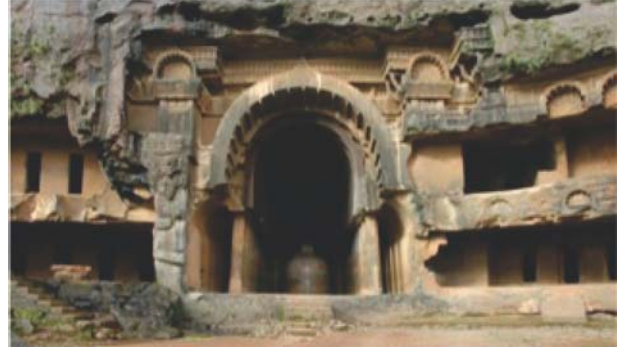
चैत्य गुफा कार्ले

ये गुफाएँ बनी हैं। हर गुफा से नीचे नदी तक जाने के लिए सीढ़ी काटी गई है। यहाँ कुल 29 गुफाएँ हैं, इनमें से पाँच गुफाएँ पूजा स्थल 'चैत्य' हैं और बाकी गुफाएँ भिक्षुओं के रहने के लिए 'विहार' हैं। 490 ईस्वी के बाद अजंता की गुफाओं को त्याग दिया गया। ऐसा लगता है मानो अजंता का इस्तेमाल करने वाला सारा समुदाय यह स्थान छोड़ कर ऐलोरा चला गया। ऐलोरा (स्थानीय भाषा में वेल्लूर) उस समय के प्रमुख व्यापारिक मार्ग पर था।