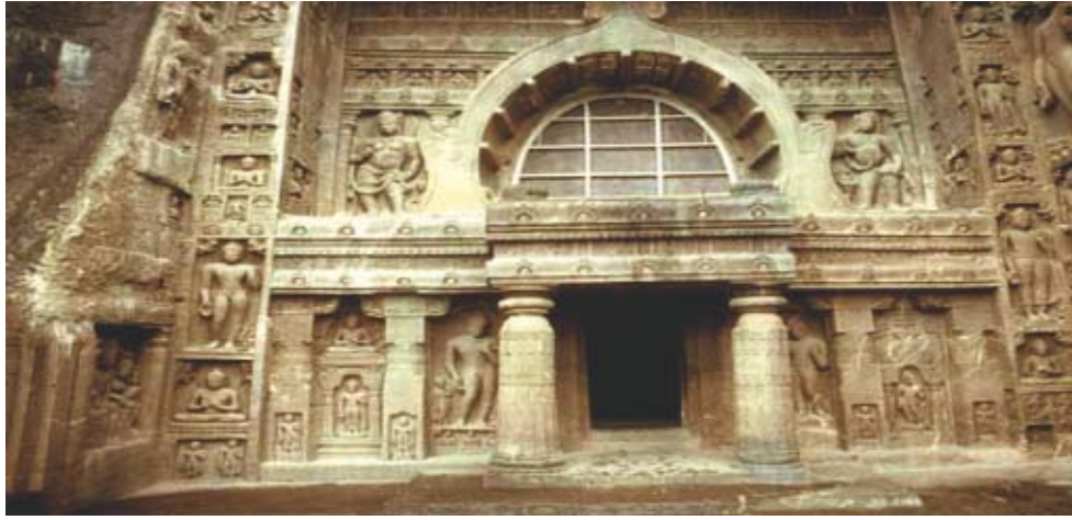
अजंता की एक गुफा का प्रवेश द्वार