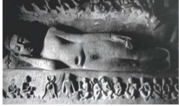
अजंता गुफा में बुद्ध निर्वाण की मूर्ति

अजंता गुफाओं के भीतर चैत्यों में निर्मित स्तूपों पर बुद्ध के चित्रों और बुद्ध के समय की अनेक कथाओं को चित्रित किया गया है। इनके साथ बचे रिक्त स्थानों को पुष्पीय अलंकरण अथवा पशु-पक्षी की आकृतियों से सजाया गया।