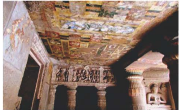
अजंता गुफाओं के प्रवेश द्वार की छत पर चित्रकारी

अजंता के भित्ति चित्रों के निर्माण के लिए पहले पहाड़ की खुरदरी दीवार को तैयार किया जाता था। इसके लिए खड़ियाँ, गोबर, बारीक बजरी का गारा, चावल की भूसी, उड़द की दाल के छिलके, अलसी को पानी में कई दिनों तक मिलाकर सड़ाया जाता था। इन सभी को मिलाकर, पीसकर पलस्तर हेतु गाढ़ा लेप तैयार कर दीवार पर एक इंच मोटा पलस्तर कर दिया जाता था। इसके ऊपर अण्डे के छिलके के मोटाई के बराबर सफेद चूने का घोल चढ़ाया जाता था। इसके बाद लाल रंग की रेखाओं से कच्चा चित्र बनाकर उसमें रंग भर दिया जाता था। चित्र में रंग भर देने और काली रेखाओं से पक्का चित्र बन जाने के बाद उसे कन्नी से पीटा जाता था, जिससे रंग दीवार की गहराई तक बैठ जाता। तत्पश्चात् पूरे चित्र को चिकने पत्थर से