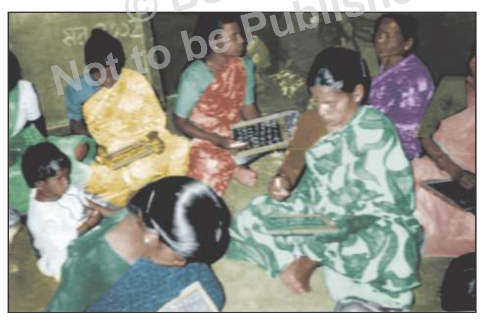
अकुशल अशिक्षित महिलाएँ शिक्षा ग्रहण करते हुए