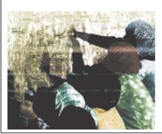
खेत में अधिसंख्यक रूप से काम करती महिलाएँ छिपी बेरोजगारी का द्योतक

भारत कृषि प्रधान देश होने के छिपी बेरोजगारी का द्योतक कारण उद्योगों का विस्तार अन्य विकसित देशों की तुलना में काफी कम हुआ है जिसके कारण उद्योगों का व्यापक विस्तार नहीं हो पाया है। दूसरी ओर ऊर्जा और संसाधनों की कमी इसके विकास की गित को धीमा बनाये हुए हैं। शिक्षित व प्रशिक्षित आबादी उद्योग क्षेत्र में रोजगार चाहती है जहाँ रोजगार की कमी होती है दूसरी ओर मशीनीकृत उद्योगों में छँटनी भी औद्योगिक क्षेत्र में बेरोजगारी को जन्म देती है।