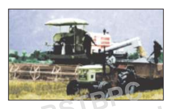
ऐसे प्रशिक्षित श्रमशक्ति का अभाव पायी जाती है