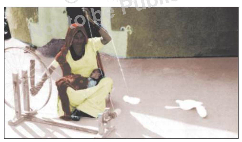
घर के काम निपटाने के बाद हाथ से सूत काटती हुई एक ग्रामीण महिला

छोटे-छोटे उद्योग जिनमें मशीन का कम प्रयोग हो और कम पूँजी पर चलाये जाते हों उस उद्योग को कटीर उद्योग कहते हैं। व्यक्ति कृषि क्षेत्र में कार्य करते हुए छिपी हुई बेरोजगारी (अदृश्य बेकारी) का शिकार होता है। ऐसी स्थिति में कृषि पर से अनावश्यक श्रमिकों का बोझ कम कर कुटीर उद्योग में लगाया जा सकता है। परिवार के सभी लोगों को काम उपलब्ध करवाकर बेकारी कम की जा सकती है। चित्र : 4.7 || || || || || ||