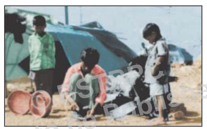
काम धंधे की उम्मीद पर अन्य काम करते लोग

भारतीय कृषि एक मौसमी व्यवसाय है। चूँिक कृषि-कार्य विभिन्न चरणों में बंटा होता है—जैसे-रोपनी, पटौनी, निकौनी तथा कटनी इत्यादि। कृषि के प्रत्येक चरण के पश्चात् कृषक-मजदूर बेकार बैठ जाते हैं, क्योंकि गाँव में इस समयाविध के लिए कृषकों के पास अन्य वैकल्पिक काम की कमी पायी जाती है और ऐसी परिस्थित में ही मौसमी बेरोजगारी का जन्म होता है।