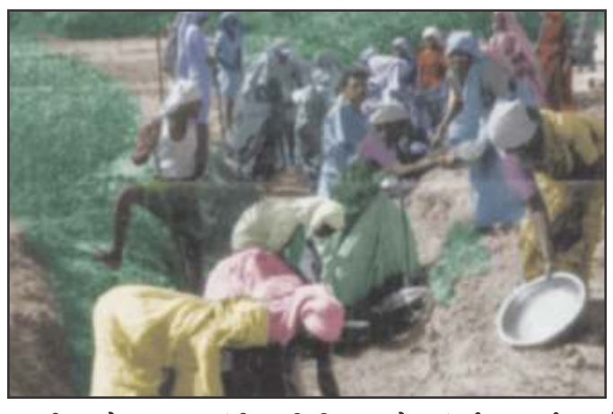
चित्र : 4.8

राष्ट्रीय ग्रामीण रोजगार गारंटी अधिनियम के अंतर्गत कार्य करते लोग