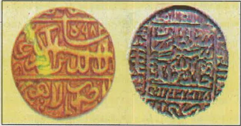
सोने का मुहर और चाँदी का रुपया

जब उत्तर भारत में मुगल साम्राज्य के समय में मुद्रा के रूप में सोने की मुहर, चाँदी का रुपया तथा ताँबे का बना दाम चलता था,