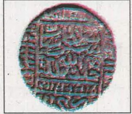
शेरशाह सूरी द्वारा चलाया गया रुपया

प्राचीन काल से आज तक मुद्रा का स्वरूप निरंतर बदलता रहा है। वस्तु-मुद्रा के बाद सर्वप्रथम धातु मुद्रा का चलन शुरू हुआ। इसमें लोहा, तांबा, पीतल, सोना, चाँदी आदि का प्रयोग किया जाता था। लेकिन धातु मुद्रा में भी कई कमी थी। यह भारी होता था, लेन-देन के बीच हमेशा संदेह बना रहता था क्योंकि इनका वजन और शुद्धता जाँचना कठिन होता था।