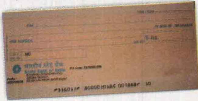
चेक का चित्र

टेलीफोन और इंटरनेट के माध्यम से भी वस्तुओं की खरीद-बिक्री होने लगी है। बैंक द्वारा भी इसके लिए कई सुविधाएँ उपलब्ध कराई गई हैं। बैंक अपने ग्राहकों को किसी वस्तु के बदले चेक द्वारा भुगतान की सुविधा प्रदान करता है।