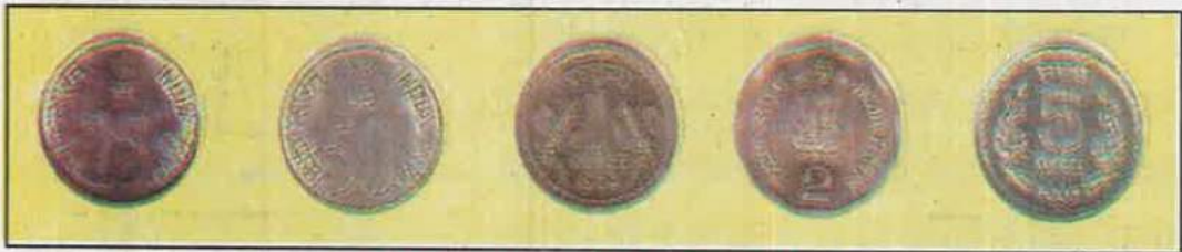
अल्युमीनियम, निकल से बने आधुनिक सिक्के

उस समय दक्षिण भारत में सोने के बने सिक्के हुण और पणम् का चलन था। परन्तु आज जो सिक्के चलते हैं वे एल्यूमीनियम तथा निकिल के बने होते हैं। इन सिक्कों की लागत इनके मूल्य से कम होती है।