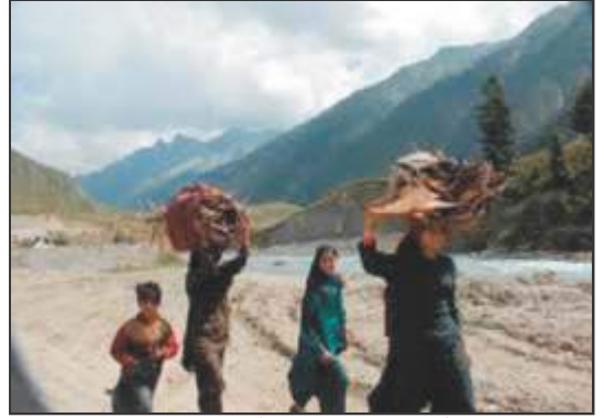
चित्र 3 – जंगल से लकड़ी काटकर और पत्ता चुनकर घर जाते हुए आदिवासी

वस्तुओं, जैसे शहद, जड़ी-बूटियां, कुछ खास तरह के फल, इत्यादि को पास के बाजार में बेचकर अपनी छोटी-मोटी आवश्यकताओं की पूर्ति भी किया करते थे। आवश्यकता की जो वस्तुएं इन्हें जंगल में उपलब्ध नहीं होती थीं, जैसे नमक, कपड़े, आदि, उनकी खरीददारी भी वे पास के गाँवों के व्यापारियों से जंगल से प्राप्त इन्हीं वस्तुओं के बदले में किया करते थे। हालांकि इसके लिए उन्हें काफी ऊँची कीमत चुकानी पड़ती थी।