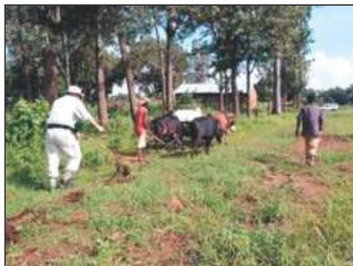
चित्र 2 – खेती पशुओं का उपयोग करता हुआ आदिवासी

काट-छांट कर साफ करते थे। दो-तीन वर्षों तक उस जगह पर खेती करने के बाद जब उस जगह की उर्वरा शक्ति समाप्त हो जाती थी तब वे किसी और स्थान पर यही प्रक्रिया दोहराते थे। कुछ वर्षों तक परती छोड़ देने के बाद पहले की जगह पर वापस जंगल उग जाता था। इससे उनके खेती का काम भी हो जाता था और जंगल को भी कोई नुकसान नहीं होता था। इस विधि को 'घुमंतु कृषि विधि' के नाम से भी जाना जाता है।