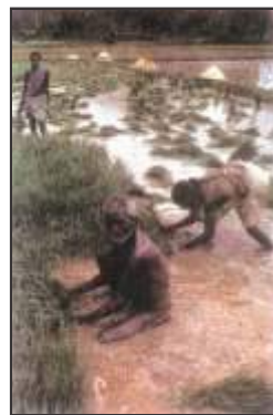
चित्र 1 – जंगलों को साफ करके खेती करते हुए आदिवासी

जनजातीय समाज के लोग आम भाषा में 'आदिवासी' भी कहलाते हैं। ऐसा इसलिए कहा जाता है कि वे इस महाद्वीप में सबसे पुराने समय से रहने वाले लोग हैं। प्राचीनकाल से ही उनका जीवन पूरी तरह से वनों पर निर्भर था। उनके गाँव बस्तियाँ आमतौर पर जंगलों के बीच या आस पास होते थे। उनके दैनिक उपयोग की अधिकांश जरूरतों की पूर्ति जंगलों से ही होती थी। हमेशा से ही ये आदिवासी पूरी स्वच्छन्दता से वन संसाधनों का उपयोग करते आ रहे थे। वे जंगलों को साफ कर खेती योग्य जमीन तैयार करते थे। समतल क्षेत्र में वे हल से खेती करते थे। यहाँ वे धान, दलहन एवं मक्का उपजाते थे। लेकिन जो पहाड़ी क्षेत्रों में रहते थे, उनकी खेती का तरीका अलग था। उसे 'झूम खेती' कहा जाता है। इसके अन्तर्गत वे जंगल के किसी भाग को