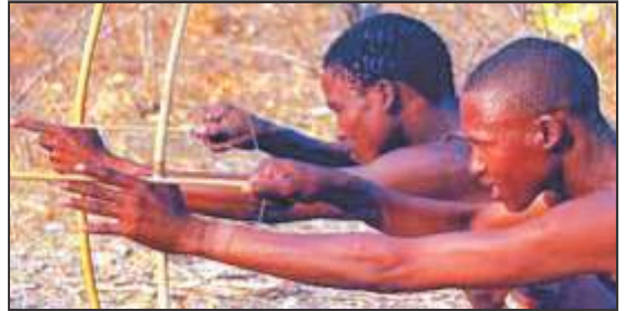
चित्र 4 – तीर धनुष से शिकार करते हुए आदिवासी

जनजातीय समाज के लोग भोजन के लिए कुछ छोटे जानवरों जैसे हिरण, तीतर तथा अन्य पक्षियों का शिकार भी करते थे। शिकार का साधन तीर-धनुष या अन्य छोटे हथियार होते थे। मगर ज्यादातर उनका भोजन जंगलों से प्राप्त कन्द-मूल, फल और अनाज ही होता था।