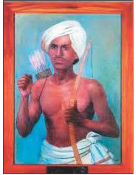
चित्र 8 – बिरसा मुंडा

गयी और वे बिरसा को पैगम्बर मानने लगे। बिरसा ने प्रचार किया कि अब मुंडा राज शुरू हो गया है और महारानी विक्टोरिया का राज समाप्त हो गया है। उसने मुंडाओं को आदेश दिया कि किसी को भी राजस्व नहीं दें और जमीन का उपभोग बिना राजस्व दिए ही करें। अंग्रेजी सरकार ने इस विद्रोह के कारण बिरसा को पकड़ कर राँची जेल भेज दिया और उस पर बगावत का आरोप लगाया गया। लेकिन जेल से छुटने के बाद बिरसा ने फिर से लोगों का समर्थन प्राप्त करना शुरू किया तथा अंग्रेजी सरकार के विरुद्ध जन संघर्ष के लिए