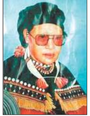
चित्र 9 – रानी गिंडाल्यू

जादोनांग ने अपनी तेरह वर्षीय चचेरी बहन गिंडाल्यू के साथ मिलकर एक भूमिगत आन्दोलन की योजना बनायी और नागा राज्य की स्थापना का प्रयास शुरू किया। इसमें जादोनांग को काफी सफलता मिल गयी। लेकिन अंग्रेजी सरकार को इसकी भनक मिल गयी। अतः एक हत्या के मामले में फंसा कर 29 अगस्त 1929 को अंग्रेजों ने उसे फांसी की सजा दे दी। आन्दोलन इसके बावजूद भी थमा नहीं। गिंडाल्यू ने इसे जारी रखा। अंग्रेजों द्वारा सन् 1932 में इस आन्दोलन को भी दबा दिया गया और गिंडाल्यू को आजीवन कारावास की सजा सुनाई गयी। सन् 1947 में आजादी मिलने के बाद उसे रिहा किया गया। गिंडाल्यू ने अंग्रेजी सरकार की दमनकारी कानूनों