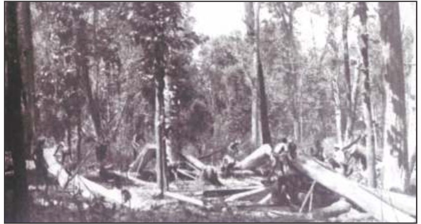
चित्र 7 – जंगल की कटाई करवाकर स्लीपर तैयार करते अंग्रेज अधिकारी

अंग्रेजों के समय एक और नई बात हुई। जंगल की लकड़ी का व्यापार अचानक ही बड़ी तेजी से बढ़ा। उस समय कोलकाता, मुंबई और चेन्नई (उस वक्त कलकत्ता, बंबई और मद्रास) जैसे बड़े-बड़े शहर बस रहे थे, मीलों लंबी रेल लाईनें बिछाई जा रही थीं और बड़े-बड़े जहाज बनाए जा रहे थे। इन सबके लिए लकड़ियों की जरूरत थी।