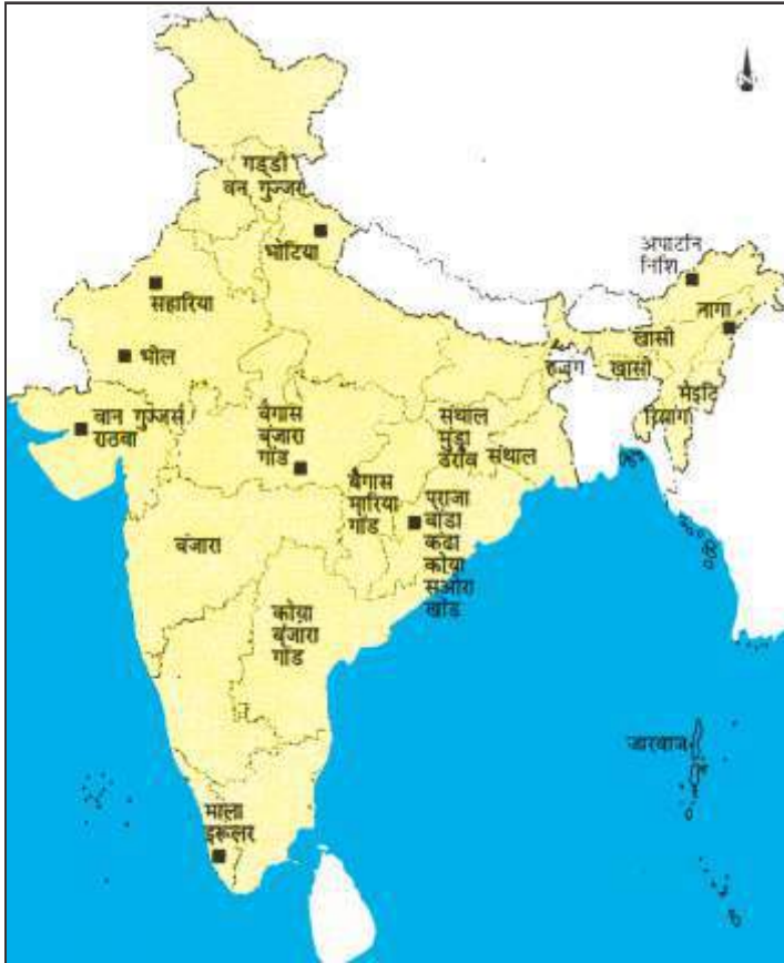
जनजाति बहुल क्षेत्रों को इंगित करता हुआ भारत का मानचित्र

पिछले अध्याय में आपने अंग्रेजों की लगान व्यवस्थाओं तथा कृषि के क्षेत्र में आ रहे बदलावों के बारे में जाना। आपने यह भी जाना कि किसानों, जमींदारों व गाँव के अन्य लोगों पर उनका क्या प्रभाव पड़ा। भारत के कई इलाकों में उनकी इन नीतियों के खिलाफ किसानों के संघर्ष की शुरुआत के बारे में आपने जाना। अब इस अध्याय में आप भारत के वनों तथा पहाड़ी क्षेत्रों में रहने वाले जनजातीय समाज के लोगों के जीवन पर अंग्रेजी शासन की नीतियों से पड़ने वाले प्रभावों के बारे में जानेंगे।