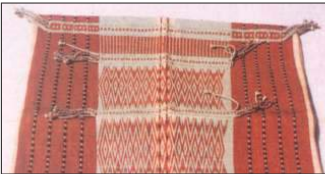
चित्र 5 – मणिपुर में जेलियांग जनजाति के द्वारा तैयार किया गया तकिया का गिलाफ

इनके उद्योग-धन्धे भी जंगलों पर ही आधारित थे। हाथी दांत, बांस तथा कुछ धातुओं पर की गई उनकी कलाकारी दूसरे समुदायों में भी काफी पसंद की जाती थी। कुछ इलाकों में रबर, गोंद, आदि चीजें उन्हें जंगलों से मिलती थीं, उसका भी वे व्यापार करते थे। आगे