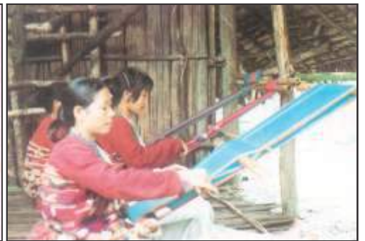
चित्र 6 – अरुणाचल प्रदेश की जनजाति महिलाओं द्वारा परम्परागत हथकरघा पर बुनाई