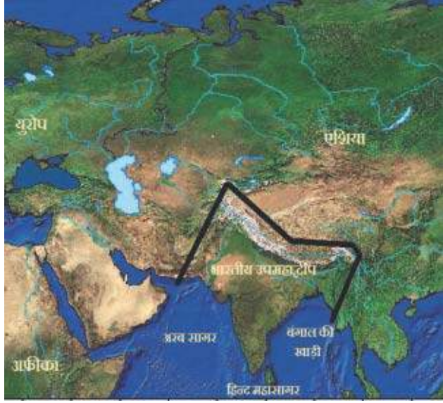
भारतीय उप महाद्वीप की भौगोलिक विविधता व उसकी एकता

देश की भौगोलिक विविधताओं को देखें तो उत्तर में हिमालय के ऊँचे पहाड़ और गंगा-यमुना का उपजाऊ मैदान है, दक्षिण में पठार और समुद्र हैं, तो पश्चिम में रेगिस्तान है। भारत में कुछ भाग ऐसे हैं, जहाँ बारह महिनों बर्फ जमी रहती है। देश में गर्मी, सर्दी और बरसात के अलग-अलग मौसम होते हैं। भारत के अलग-अलग भागों में खान-पान भी अलग-अलग हैं। उदाहरण के लिए दक्षिण में इड़ली-डोसा, राजस्थान में दाल-बाटी-चूरमा, गुजरात में ढोकला-खमण, पंजाब में मक्की की रोटी और सरसों का साग और बिहार में लिट्टी चोखा प्रचलित हैं। एक क्षेत्र से दूसरे क्षेत्र के वस्त्रों और पहनावे की शैली में भी अन्तर है।