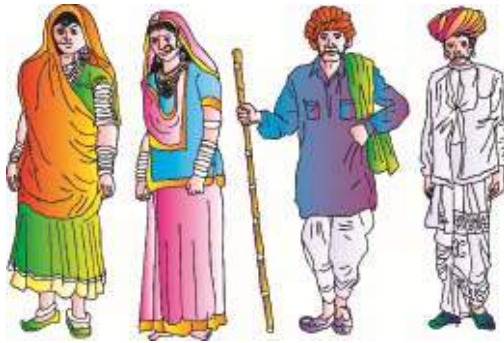
पहनावे की विविधता

भारत में विविधता के कई पक्ष हैं, जैसे- नृजातीयता, भाषा, रंगरूप, शरीर की बनावट, काम करने के तरीके, पूजा-पद्धतियाँ, जाति, कला और संस्कृति आदि। देश में सैकड़ों समुदाय हैं। यहाँ सैकड़ों बोलियाँ और अनेक भाषाएँ बोली जाती हैं। विश्व का शायद ही कोई ऐसा बड़ा धर्म और पंथ हो जो भारत में प्रचलित नहीं हो। हिन्दू, मुस्लिम, सिक्ख, ईसाई, जैन, बौद्ध, पारसी आदि अनेक धर्मों एवं पंथों को मानने वाले लोग हमारे देश में निवास करते हैं। देश के हर इलाके में वहाँ की अपनी लोककथाएँ, लोकगीत एवं नृत्य मिलते हैं, जिनका संबंध मौसम और फसल बोने या काटने के अवसरों के साथ जुड़ा हुआ है। असम में बीहू, केरल में ओणम, तमिलनाडु में पोंगल, राजस्थान में गणगौर और तीज, बिहार में छठपूजा, पंजाब में बैसाखी आदि त्योहार मनाए जाते हैं। हर धर्म के अपने-अपने त्योहार हैं। भारत में दीपावली, होली, दुर्गापूजा, महावीर जयंती, ईद, क्रिसमस, गुरुनानक-जयंती, नवरात्रि आदि त्योहार बड़े धूमधाम से मनाये जाते हैं।