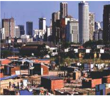
कच्ची बस्तियाँ व बहुमंजिला भवन

शहरों के लोग अधिक व्यस्त रहते हैं। शहरी जीवन भाग-दौड़ भरा होता है। यहाँ ऊँची-ऊँची इमारतों का जाल और वाहनों की रेलम-पेल रहती है। यहाँ हरियाली और खुलापन बहुत कम रहता है। वाहनों और कारखानों से निकले धुआँ से हवा और वातावरण प्रदूषित रहता है। दूसरी ओर शहरों में रोजगार के बहुत से ऐसे क्षेत्र हैं, जिनमें योग्यता हासिल करके आगे बढ़ा जा सकता है। यहाँ शिक्षा प्राप्त लोगों को रोजगार मिलने की संभावनाएँ अधिक होती हैं। यही कारण है कि लोग ग्रामीण क्षेत्रों से पलायन करके शहरों में बसते जा रहे हैं।