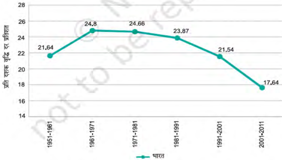
चित्र 6.4(अ): भारत की जनसंख्या वृद्धि दर 1951-2011 के दौरान

35.1. किस दशक में जनसंख्या वृद्धि दर में बढ़ोत्तरी देखी गयी?