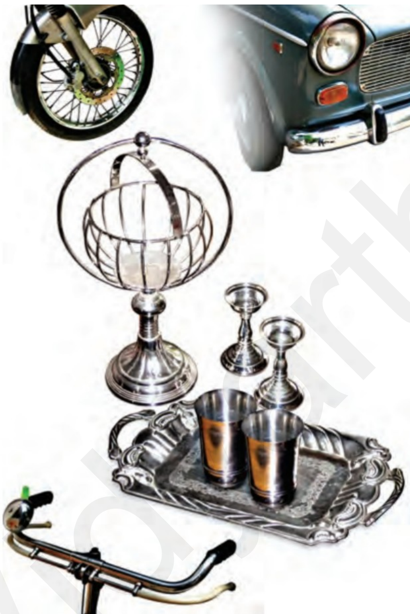
कुछ विद्युतलेपित वस्तुएँ