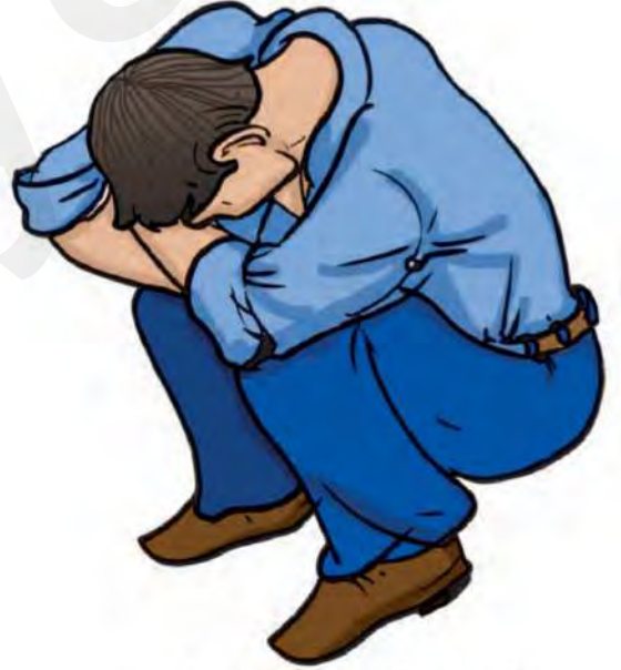
तड़ित के समय सुरक्षित स्थिति।

तड़ित चालक- जब आसमान से बिजली नीचे गिरती है तो वह बड़ी-बड़ी इमारतों पर गिर जाती है। उससे बचने के लिए हम एक धातु की छड़ अपनी छत पर लगाते हैं जो जमीन से जुड़ी होती हैं। जब भी कोई आवेशित बादल और छड़ के आस पास से गुजरता है तो वह छड़ उसका सारा आवेश सोख लेती है। इससे भवन सुरक्षित रहता है।