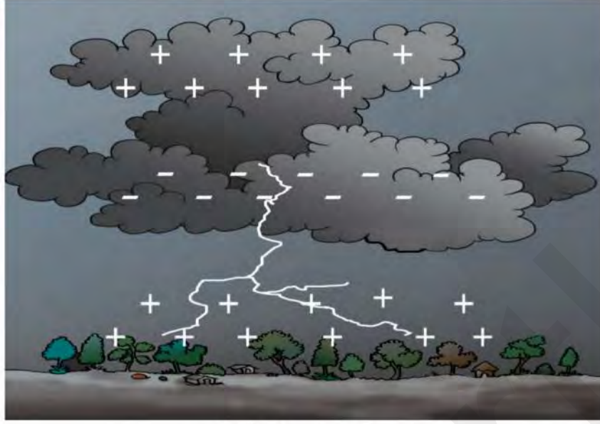
आवेश के संचयन से तड़ित का होना