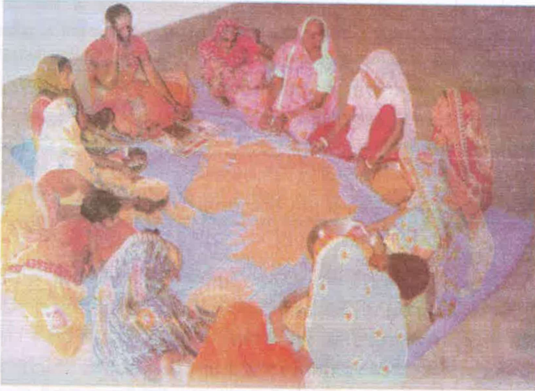
चित्र 4.1 : स्वयं सहायता समूह

इसे दिए गए चित्र संख्या 4.1 के माध्यम से आसानी पूर्वक समझा जा सकता है—