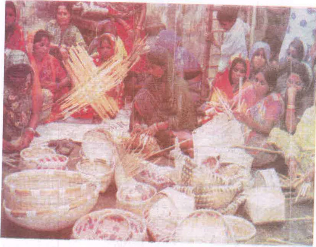
चित्र 4.2 : स्वयं सहायता समूह के द्वारा टोकरी निर्माण करती महिलाएँ

उपरोक्त चित्र संख्या 4.2 में स्वयं सहायता समूह के माध्यम से टोकरी बनाती हुई महिलाओं को दिखाया गया है।