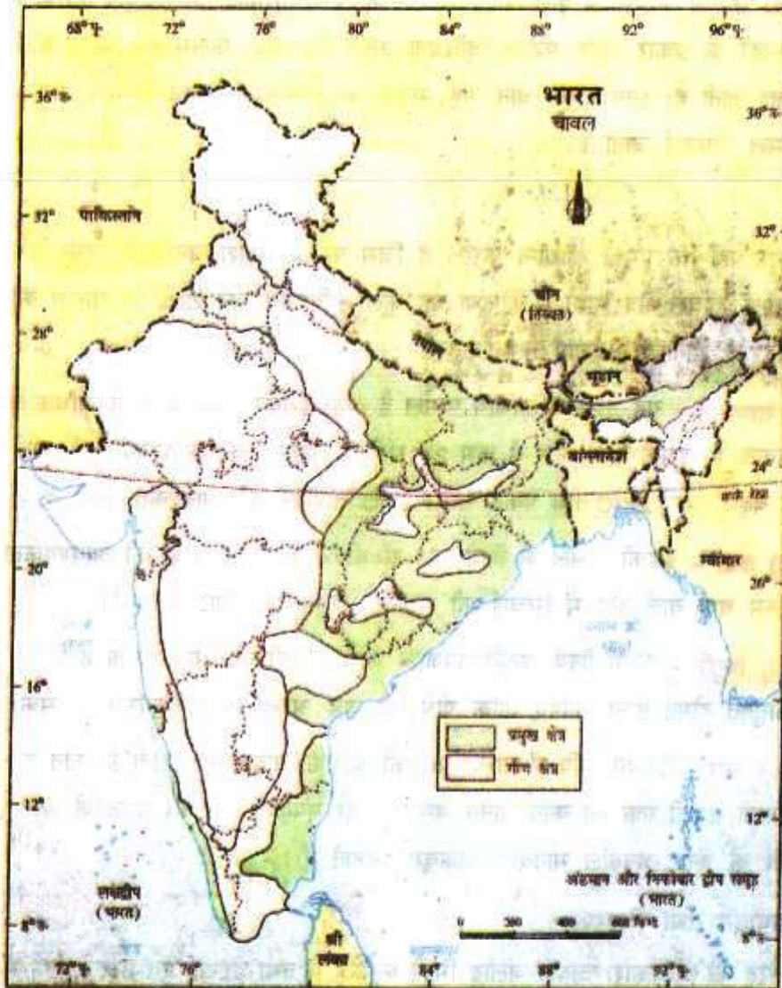
चित्र 2.1 भारत : चावल का वितरण

सतलज-गंगा के मैदान में सिंचाई की सहायता से चावल की कृषि ने उल्लेखनीय प्रगति की है। इसके मुख्य उत्पादक राज्य प० बंगाल, बिहार, उत्तरप्रदेश, आंध्रप्रदेश, उड़ीसा, छत्तीसगढ़, असम, केरल, तमिलनाडु आदि हैं। प० बंगाल में चावल की तीनों ही किस्में उपजाई जाती हैं।