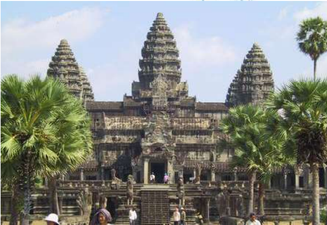
अंकोरवाट का मन्दिर

3, री शताब्दी में शी-हुआंग टी का प्रभुत्व उसके बाद हान वंशीय राजा बू-ती ने पून: इन क्षेत्रों पर कब्जा किया। फिर 15 वी शताब्दी में मिंग वंशी सम्राट के युंग ली ने अधिकार किया था। 19 वीं शताब्दी में यह क्षेत्र मंचु शासन के अधिन था।