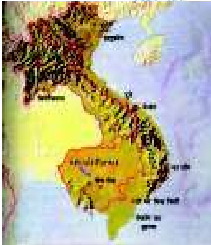
चित्र - हिन्द-चीन का मानचित्र

दक्षिण पूर्व एशिया में हिन्दचीन देशों से अभिप्राय तत्कालिन समय में लगभग 3 लाख (2.80 लाख) वर्ग कि०मी० में फैले उस प्रायद्वीपीय क्षेत्र से है जिसमें आज के वियतनाम, लाओस और कम्बोडिया के क्षेत्र आते हैं। इनकी उत्तरी सीमा मयनमार एवं चीन को छूती है तो दक्षिण में चीन सागर है और पश्चिम में मयनमार के क्षेत्र पड़ते हैं।