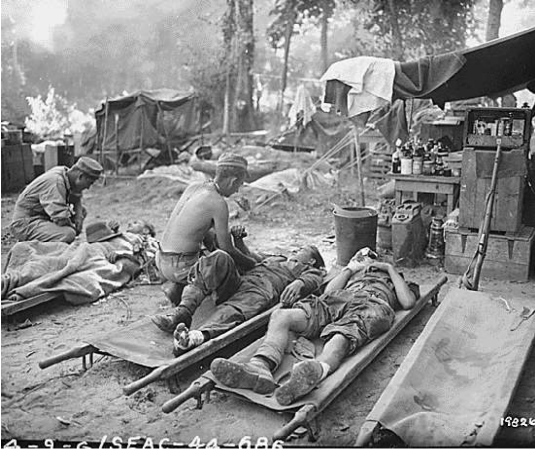
जापान का हिन्द चीन पर आक्रमण

यह हिन्द चीन में एक तरह का द्वैध शासन था जिसमें सत्ता जापानियों के हाथ थी एवं प्रशासनिक मुखौटा फ्रांसीसियों का था। इस के फलस्वरूप वियतनाम के गुप्त क्रांतिकारियों को