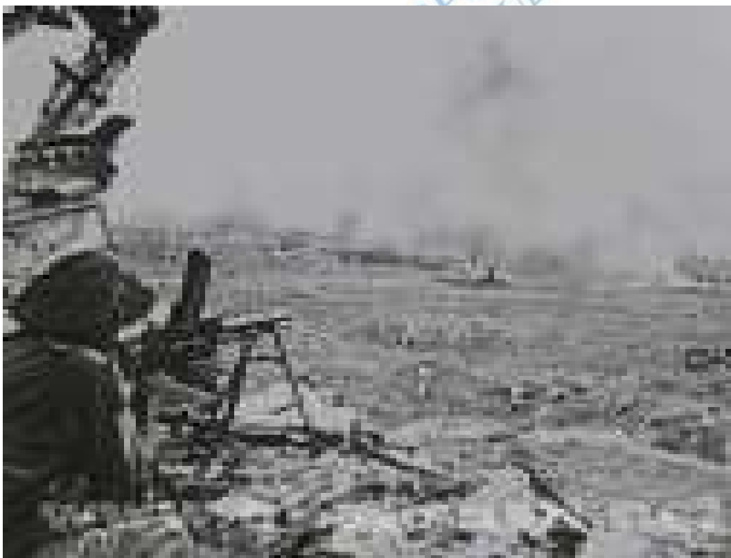
दिएन वियेन फू के युद्ध में गोली चलाना वियतनामी सिपाही

गुरिल्ला युद्ध का लाभ उठाते हुए फ्रांस ने पेरिस से बाओदाई को बुलाकर वियतनाम का शासक बना दिया। चूंकी फ्रांस को उम्मीद थी कि कम्युनिष्ट विरोधी वियतनामी बाओदाई का समर्थन करेगे। अब तक पूरा विश्व दो खेमो में बंट चुका था पूँजीवादी एवं साम्यवादी। पूँजीवादी देशों, यथा अमेरिका एवं ब्रिटेन का समर्थन भी फ्रांस को प्राप्त था। इससे हो ची मिन्ह को कुछ परेशानियाँ उठानी पड़ी क्योंकि अभी तक वह पूर्ण साम्यवादी सरकार का गठन नहीं कर पाया था। उसके संयुक्त मोर्चों में गैर साम्यवादी राष्ट्रवादी ताकते भी थी। परन्तु 1949 में हो ची मिन्ह ने खुले तौर पर जनवादी चीनी गणराज्य को अपना आदर्श स्वीकार कर लिया और पूर्णतः साम्यवादी बन गया। 1950 में रूस एवं चीन ने वियतनाम गणराज्य को मान्यता दे दी साथ ही अत्यधिक सैनिक एवं तकनीकी सहायता उपलब्ध कराना शुरू कर दिया।