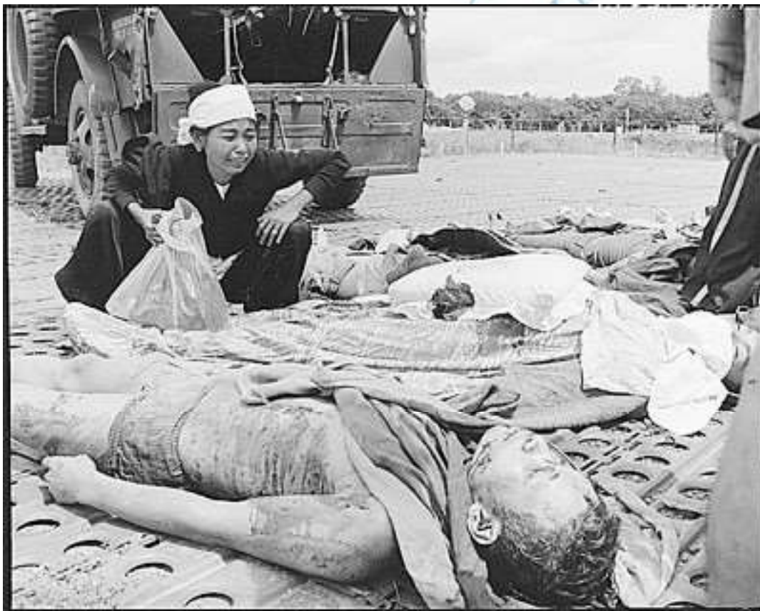
हो चीन मिन्ह मार्ग पर बमबारी का चित्र

हुआ, जिसमें लाओस के तीनो पक्षो की भागीदारी पर रूस अमेरिका भी सहमत थे। मई 1961 में यह सम्मेलन हुआ जिसमें सभी राजकुमारो ने संयुक्त मंत्रिमण्डल के गठन पर सहमति प्रदान की और मंत्रिमण्डल भी बना, परन्तु अमेरिकी षडयंत्र के कारण लाओस के विदेश मंत्री की हत्या हो गयी और गृह युद्ध पुनः शुरू हो गया। चूँकि अमेरिका लाओस में साम्यवादी प्रसार नहीं चाहता था, अतः चुनाव द्वारा सुवन्न फूमा को प्रधानमंत्री बनाया गया और सुफन्न बोंग उप प्रधानमंत्री बना। इससे असंतुष्ट पाथेट लाओ ने सन् 1970 में लाओस पर आक्रमण कर जार्स के मैदान पर कब्जा कर लिया। हलांकि अमेरिका ने इस युद्ध में जम कर बमबारी किया परन्तु पाथेट लाओ के आक्रमण को रोका नहीं जा सका।