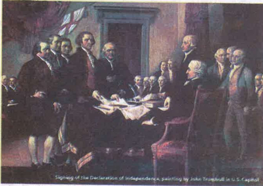
अमेरिकी स्वतंत्रता की घोषणा

5 सितम्बर 1774 ई० को 13 उपनिवेशों के प्रतिनिधियों का फिलाडेल्फिया शहर में एक महादेशीय सम्मेलन आयोजित किया गया जिसमें ब्रिटिश कानूनों का विरोध तथा व्यापार के बहिष्कार का निर्णय हुआ। 18 अप्रैल 1775 को ब्रिटिश सेना तथा उपनिवेश वासियों के बीच लेक्सिंगटन में प्रथम संघर्ष हुआ। इसके पश्चात् 4 जुलाई 1776 ई० में फिलाडेल्फिया में दूसरा महादेशीय सम्मेलन आयोजित हुआ। इसमें टॉमस जैफर्सन द्वारा तैयार किया गया 'स्वतंत्रता का घोषणा पत्र' जारी किया