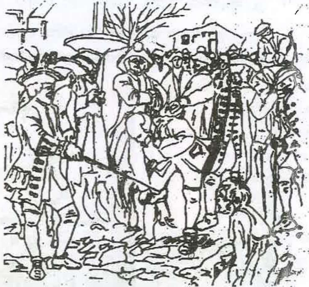
स्टॉप एक्ट का विरोध करते हुए उपनिवेशवासी

सप्तवर्षीय युद्ध में इंग्लैण्ड की काफी आर्थिक क्षति हुई थी। अतः क्षतिपूर्ति हेतु तत्कालीन प्रधानमंत्री ग्रेनविले ने 1765 ई० में स्टॉप एक्ट पारित किया जिसके अनुसार सभी अदालती कागजों, अखबारों आदि पर 20 शिलिंग का स्टॉप लगाना अनिवार्य था। इस कानून से उपनिवेशों में व्यापक विरोध की भावना जाग उठी और उपनिवेशवासियों ने ब्रिटेन से आने वाली सभी वस्तुओं का बहिष्कार करने का निश्चय किया। 1767 ई० में ब्रिटिश संसद ने उपभोक्ता वस्तुओं पर कर लगाया। ये वस्तुएँ थी - कागज, शीशा, चाय एवं रोगन। उपनिवेशवासियों ने इन करों का व्यापक विरोध किया तथा सैमुअल एडम्स ने ‘प्रतिनिधित्व नहीं तो