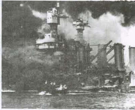
अमेरिका के पर्ल हॉर्बर बन्दरगाह पर जापानी आक्रमण का दृश्य

जापान ने 7 दिसम्बर 1941 को हवाई द्वीप स्थित पर्ल हार्बर के अमेरिकी नौसैनिक अड्डे पर जबर्दस्त हमला किया। इसके कारण अमेरिका का प्रशान्त महासागर स्थित बेड़ा जो वहाँ रखा गया था तहस-नहस हो गया। जिसकी वजह से अमेरिका ने 8 दिसम्बर 1941 को जापान के विरुद्ध युद्ध की घोषणा की। उसके बाद जर्मनी और इटली ने अमेरिका के खिलाफ युद्ध की घोषणा कर दी। अमेरिका के युद्ध में शामिल होने के बाद अमेरिकी महाद्वीप के सारे देश जर्मनी, इटली और जापान (धुरी राष्ट्र) के विरुद्ध युद्ध में शामिल हो गये।