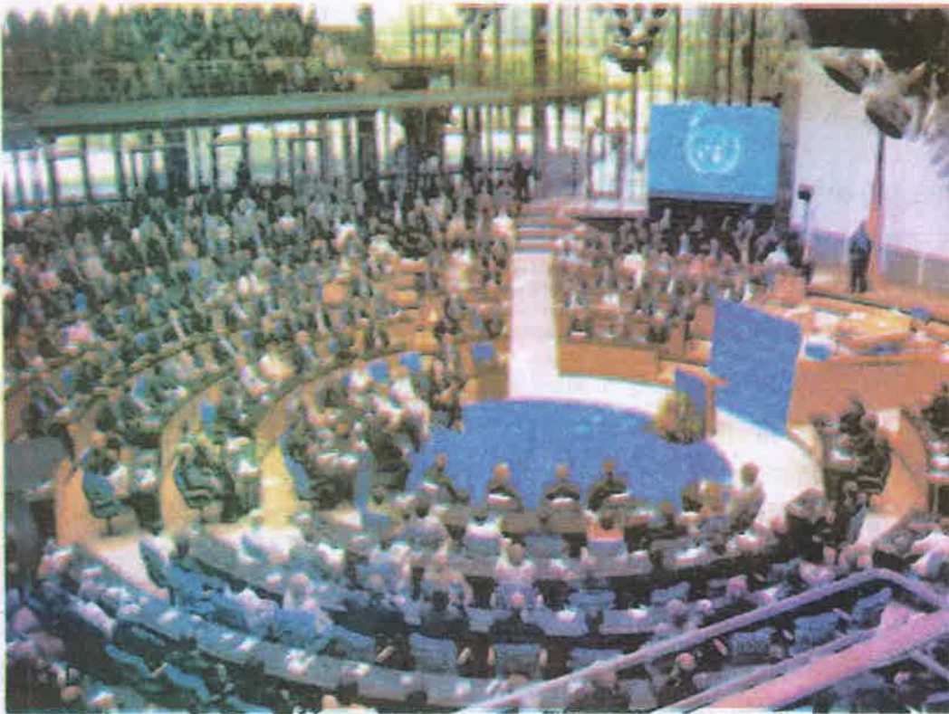
संयुक्त राष्ट्रसंघ के आमसभा का दृश्य

संयुक्त राष्ट्रसंघ के प्रथम महासचिव ट्रिग्वेली तथा वर्तमान महासचिव ब्यानकी मून हैं (दक्षिण कोरिया के)