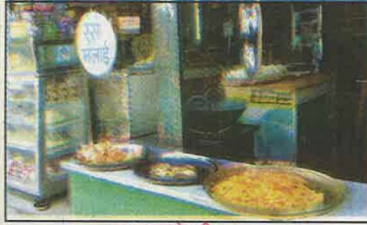
चाय, नास्ते की दुकान

आपने समाज में मौजूद अनेक तरह की विविधताओं के विषय में जाना। भारत गाँवों का देश है। यहाँ लगभग छः लाख से भी अधिक गाँव हैं। यदि आप अपने आस-पड़ोस पर नजर डालें तो पायेंगे कि लोगों के जीवन-यापन संबंधी कार्यों में भिन्नता पाई जाती है। इस पाठ में हम देखेंगे कि लोगों के पास जीवन-यापन के समान अवसर है या नहीं। साथ ही यह भी जानेंगे कि ग्रामीण जीवन-यापन की स्थितियाँ एक-दूसरे से कितनी मिलती हैं या अलग हैं? उन्हें किन-किन समस्याओं का सामना करना पड़ता है?