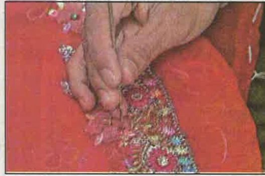
जरी-गोटा लगाने का काम

अभी तक आप ने देखा कि ग्रामीण क्षेत्रों में लोग कैसे जीवन-यापन करते हैं और आजीविका के लिए कितना कमा पाते हैं, यह इस बात पर निर्भर करता है कि वे जिस जमीन को जोतते हैं वह कैसी है। कई लोग उस जमीन पर कृषक मजदूर के रूप में निर्भर हैं। ज्यादातर