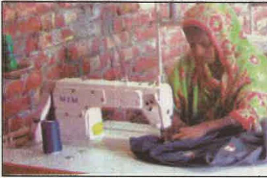
सिलाई का काम