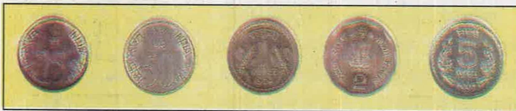
अल्युमीनियम, निकल से बने आधुनिक सिक्के

उस समय दक्षिण भारत में सोने के बने सिक्के हुण और पणम् का चलन था। परन्तु आज जो सिक्के चलते हैं वे एल्यूमीनियम तथा निकिल के बने होते हैं। इन सिक्कों की लागत इनके मूल्य से कम होती है।