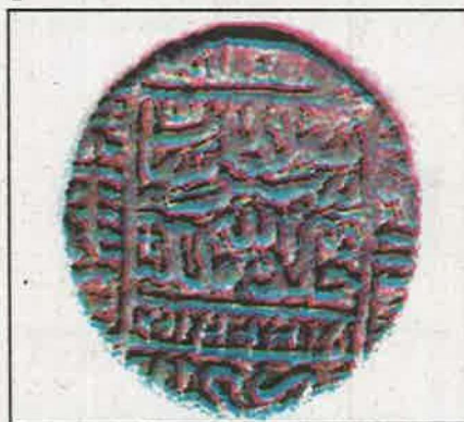
शेरशाह सूरी द्वारा चलाया गया रुपया

प्राचीन काल से आज तक मुद्रा का स्वरूप निरंतर बदलता रहा है। वस्तु-मुद्रा के बाद सर्वप्रथम धातु मुद्रा का चलन शुरू हुआ। इसमें लोहा, तांबा, पीतल, सोना, चाँदी आदि का प्रयोग किया जाता था। लेकिन धातु मुद्रा में भी कई कमी थी। यह भारी होता था, लेन-देन के बीच हमेशा संदेह बना रहता था क्योंकि इनका वजन और शुद्धता जाँचना कठिन होता था।