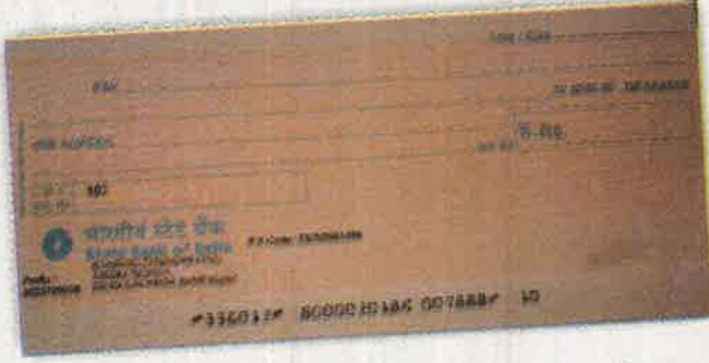
चेक का चित्र

टेलीफोन और इंटरनेट के माध्यम से भी वस्तुओं की खरीद-बिक्री होने लगी है। बैंक द्वारा भी इसके लिए कई सुविधाएँ उपलब्ध कराई गई हैं। बैंक अपने ग्राहकों को किसी वस्तु के बदले चेक द्वारा भुगतान की सुविधा प्रदान करता है।