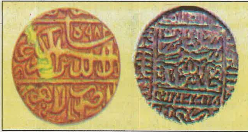
सोने का मुहर और चाँदी का रुपया

जब उत्तर भारत में मुगल साम्राज्य के समय में मुद्रा के रूप में सोने की मुहर, चाँदी का रुपया तथा ताँबे का बना दाम चलता था,