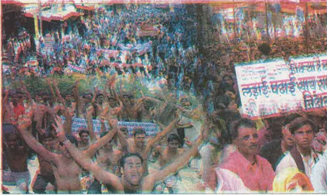
धरना एवं आंदोलन करते लोग

यदि सरकार जनता के कार्यों को सही रूप से नहीं करती हो तो जनता -