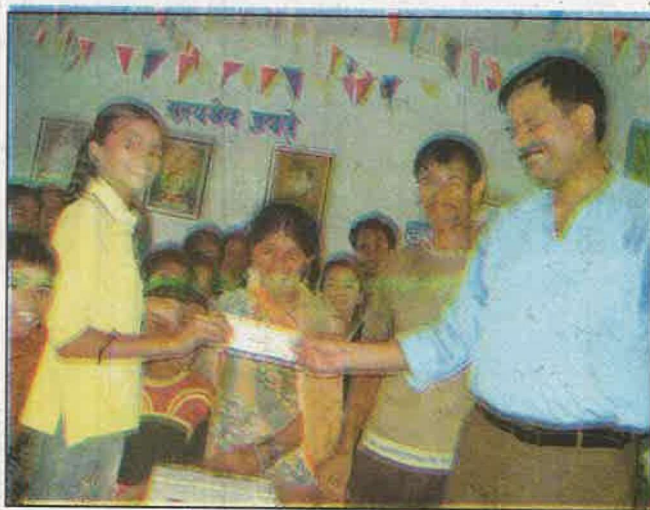
पोशाक की राशि प्राप्त करती छात्राएँ

एवं अन्यायपूर्ण है। इस पर सरकार ने विशेष ध्यान देते हुए लड़कियों की शिक्षा हेतु सरकारी विद्यालयों एवं कॉलेजों में फीस खत्म कर दी है। उनके लिए पोशाक योजना आरंभ की गई है। उसी तरह महादलित बच्चे – बच्चियों पर भी सरकार ने विशेष ध्यान रखते हुए पोशाक के साथ-साथ छात्रवृत्ति योजना आरंभ किया है ताकि उन्हें भी समान अवसर मिल सके।