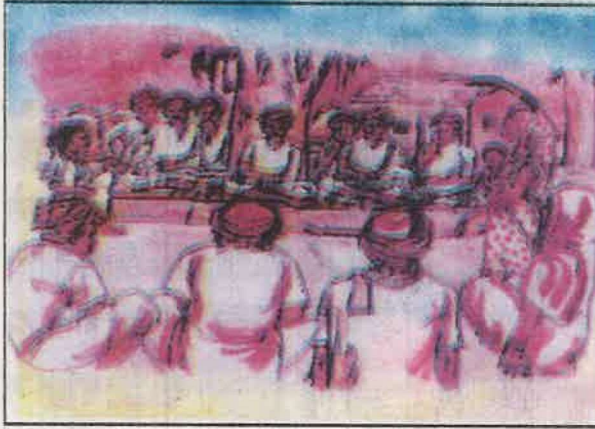
ग्राम पंचायत के लोग आम सभा करते हुए

की है जिसमें महादलितों एवं गरीब परिवार की संख्या सबसे अधिक है। फिर भी वहाँ एक ही सार्वजनिक चापाकल है जिसका सभी लोग उपयोग करते हैं। इससे काफी कठिनाई होती है। साथ ही वह चापाकल कभी-कभी खराब हो जाता