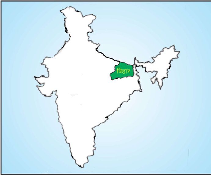
चित्र 8.1 भारत में बिहार की अवस्थिति