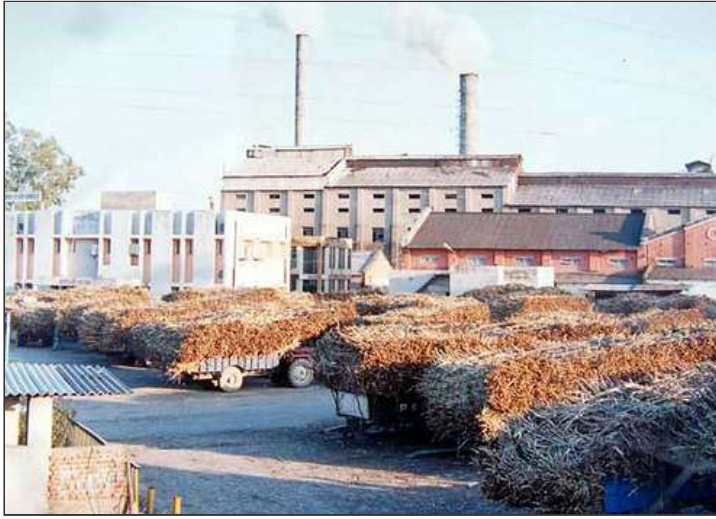
चित्र 8.4 चीनी मिल का दृश्य