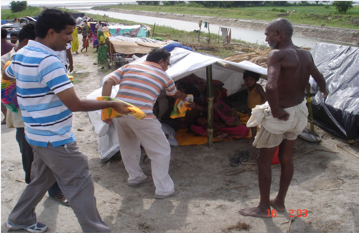
चित्र 8.3 बाढ़ राहत शिविर में सामग्री वितरण