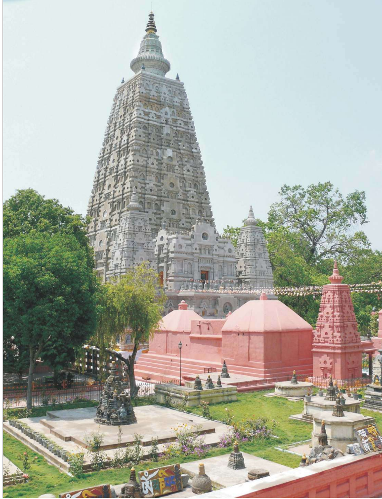
चित्र 9.1 महाबोधि मंदिर (बोधगया)

बोधिवृक्ष के नीचे बैठकर कई बौद्ध भिक्षु भगवान बुद्ध