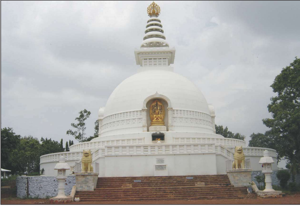
चित्र 9.3 शांतिस्तूप (राजगीर )

सबने खाना खाया। इसी क्रम में शिक्षक ने बताया कि राजगीर चारों ओर पहाड़ियों से घिरा हुआ है। इन पहाड़ियों में गंधक है इसलिए यहां से गर्म पानी का स्राव होता है। बच्चों ने मनियारमठ, जरासंध का अखाड़ा देखा तथा शांति स्तूप देखने रज्जू मार्ग द्वारा (रोप-वे) पहाड़ी की ओर चल पड़े।