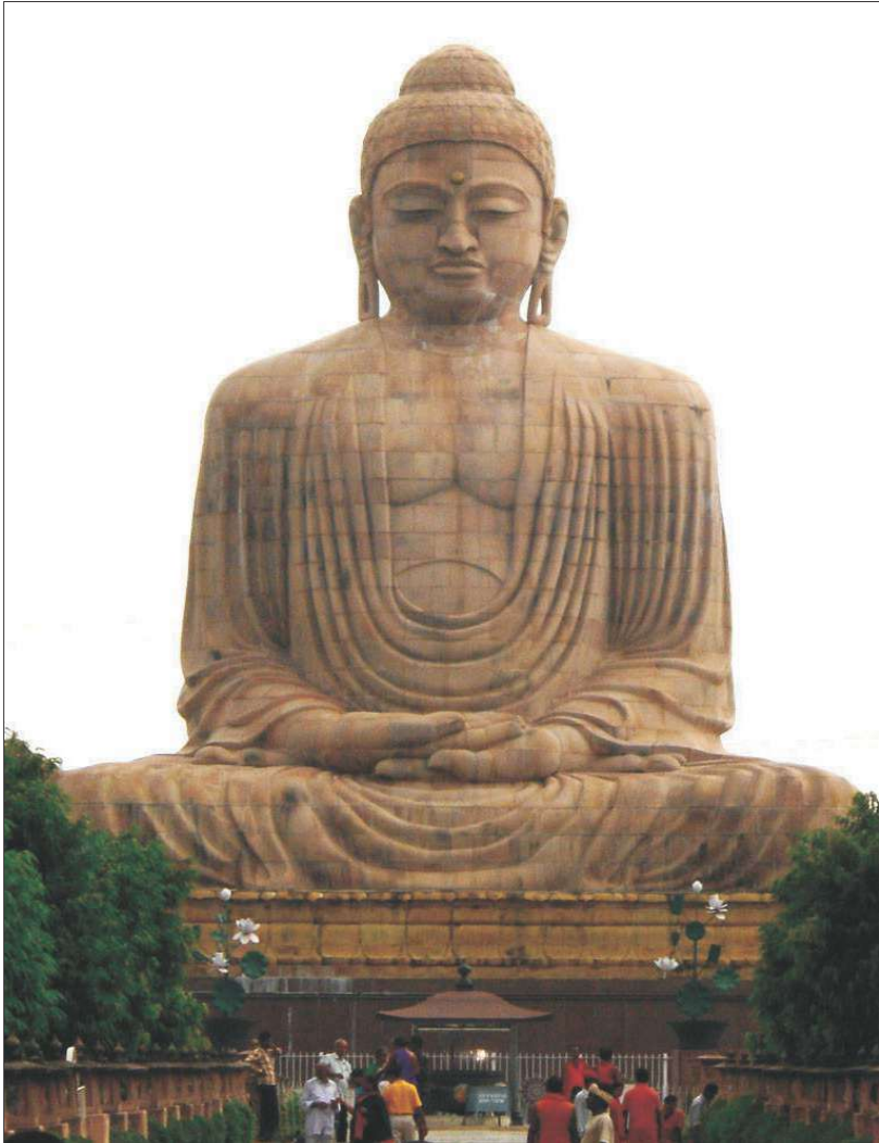
चित्र 9.2 ध्यानरत महात्मा बुद्ध

की आराधना कर रहे थे। इस मंदिर के बगल में स्थित 'मुचल्लिंद सरोवर' में बच्चों ने मछलियों को दाना खिलाया। सरोवर में मछलियाँ भरी पड़ी थीं। इतनी सारी मछलियों को देखकर बच्चों के आनंद की सीमा नहीं रही। मंदिर के इर्द-गिर्द कई देशों ने भगवान बुद्ध की