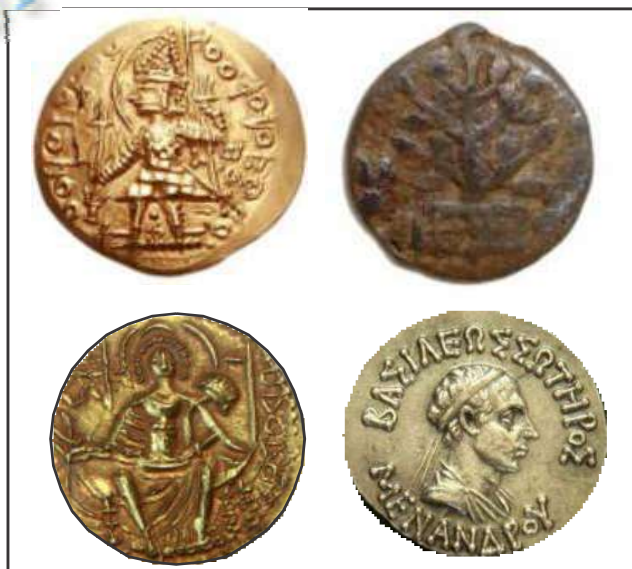
कुषाणकालिन सिक्के, सातवाहन सिक्के, शक सिक्के और हिन्द यवन सिक्के चित्र