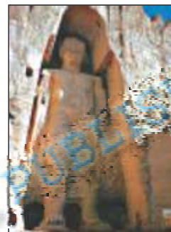
वामियान स्थित भगवान बुद्ध

शृंग शैली : शृंग कला में स्तूप के चारों ओर एक ऊँची चहारदीवारी बनायी जाती थी तथा चार तोरण द्वार लगाए जाते थे जिसको जातक कथाओं बौद्ध चिहनों, नाग एवं अप्सरा की मूर्तियों से सजाया जाता था। भारहुत और सांची का स्तूप इस कला का उदाहरण है।