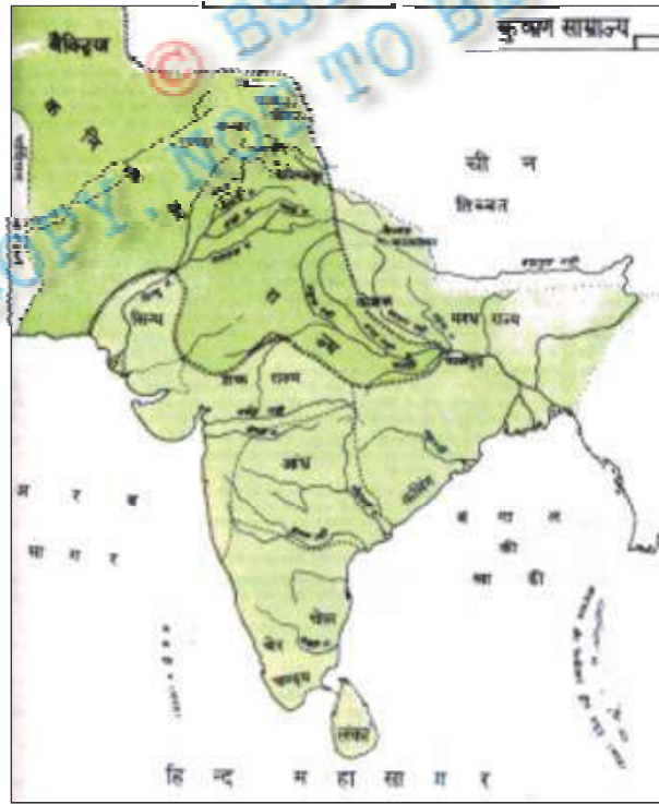
कनिष्क के समय का भारत का मानचित्र

कुषाण : विदेशी आक्रमणों की श्रृंखला में कुषाणों का स्थान सबसे महत्वपूर्ण है । कुषाण यू-ची कबीला की एक शाखा थे । भारत में इस वंश का प्रथम शासक कुजुल कडफिसस हुआ । उसने काबुल और कश्मीर में अपनी सत्ता स्थापित की । इस वंश का सबसे महान शासक कनिष्क था । उसके समय के कुषाण साम्राज्य के अन्तर्गत अफगानिस्तान, सिन्ध, बैक्ट्रिया, पार्थिया आदि के प्रदेश सम्मिलित थे ।