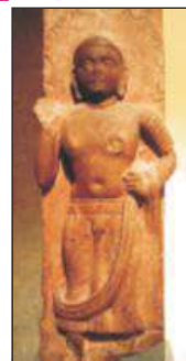
भगवान बुद्ध मथुरा शैली

मथुरा शैली : कुषाण काल में मथुरा भी कला का प्रमुख केन्द्र था। इसमें बुद्ध की मूर्तियां बनाने में स्पष्टतः सोच भारतीय है। इनमें यूनानी