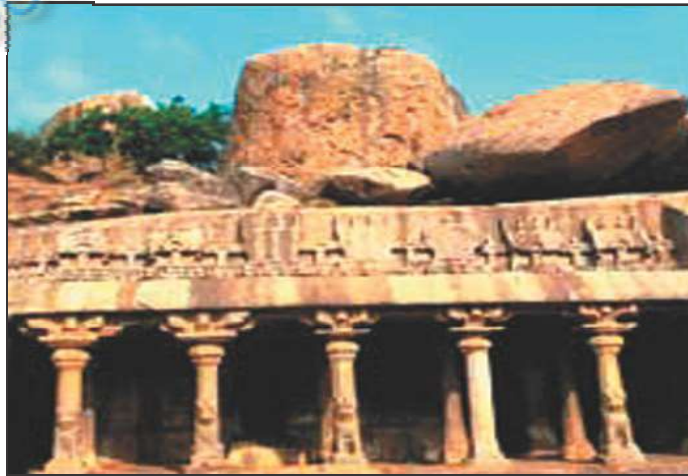
उदयगिरि का गुहा मंदिर

इस काल के गुहामंदिरों का सर्वश्रेष्ठ नमूना उदयगिरि का गुहामंदिर है। इसे चन्द्रगुप्त द्वितीय का सेनापति वीरसेन ने बनवाया था। इसके भीतर एक गर्भगृह तथा उसके सामने मंडप है। इसमें बराह अवतार की विशाल मूर्ति उत्कीर्ण है। दीवारों पर अलंकरण एवं पच्चीकारी भी है।