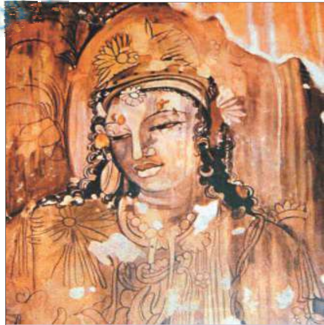
मरणासन्न राजकुमारी (अजंता की गुफा)

अजंता की चित्रकारी में जहाँ धार्मिक दृश्यों की प्रधानता है, वही बाघ की गुफाओं में सांसारिक (लौकिक) दृश्यों का चित्रण है। इन चित्रों से उस समय की वेश—भूषा, केश—सज्जा एवं अलंकरण (सजावट) सामग्री की जानकारी मिलती है। यहाँ का सबसे महत्वपूर्ण चित्र संगीत एवं नृत्य से संबंधित है। भगवान बुद्ध से संबंधित भी कुछ चित्र हैं लेकिन