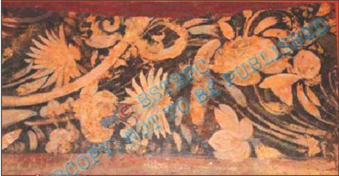
बाघ की गुफा के चित्रकारी का दृश्य

इन सभी चित्रों को राजकीय संरक्षणमें बनाया गया। जिन शिल्पकारों के द्वारा ये चित्र बनाए गए उनके बारे में हमें जानकारी नहीं मिलती है। इन्हें बनाने में काफी घन खर्च किए गए होंगे। उपरोक्त चित्रों के अतिरिक्त सिक्कों पर भी चित्रकारी की गई है जिन्हें आप पिछले अध्याय में देख चुके हैं। इन सिक्कों में समुद्रगुप्त वीणावादक एवं व्याघ्रपराक्रमांक रूप में दिखाया गया है।