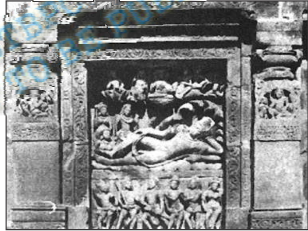
शेषशायी भगवान विष्णु की मूर्ति

विष्णु की यह प्रसिद्ध मूर्ति देवगढ़ के दशावतार मंदिर में है। इस मूर्ति में भगवान विष्णु को शेषनाग की शैय्या पर आराम की मुद्रा में दिखाया गया है। वे कुंडल, मुकुट, माला, हार, कंगन आदि से सुशोभित हैं। इनके एक ओर शिव और इन्द्र की मूर्ति है समीप में दो शस्त्रधारी पुरुष हैं। कार्तिकेय मयूर पर आसीन हैं तथा नाभि से निकले कमल पर चार मुख वाले ब्रह्मा विराजमान हैं। लक्ष्मी पैर दबा रही है। काशी से गोवर्धन पर्वत को गेंद के समान उठाए श्री कृष्ण की भी मूर्ति मिली है।