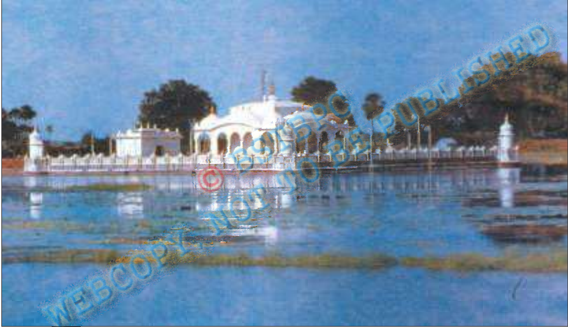
पावापुरी का जल मंदिर

ज्ञान प्राप्ति के बाद वे महावीर कहलाए। बहत्तर वर्ष की उम्र में 468 ई0पू0 में पावापुरी में उनकी मृत्यु हुई।