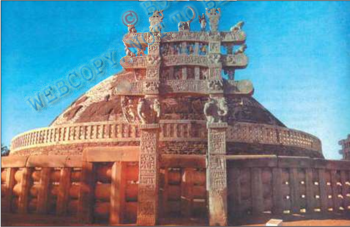
अशोक द्वारा निर्मित सारनाथ का स्तूप

महात्मा बुद्ध ने अपना पहला उपदेश सारनाथ में दिया। यह घटना 'धर्मचक्र प्रवर्तन' कहलाता है। इस घटना को यादगार बनाने के लिए बाद में सम्राट अशोक ने (अशोक के बारे में आप विस्तृत रूप से अगले अध्याय में पढ़ेंगे)। सारनाथ में एक विशाल स्तूप का निर्माण करवाया।