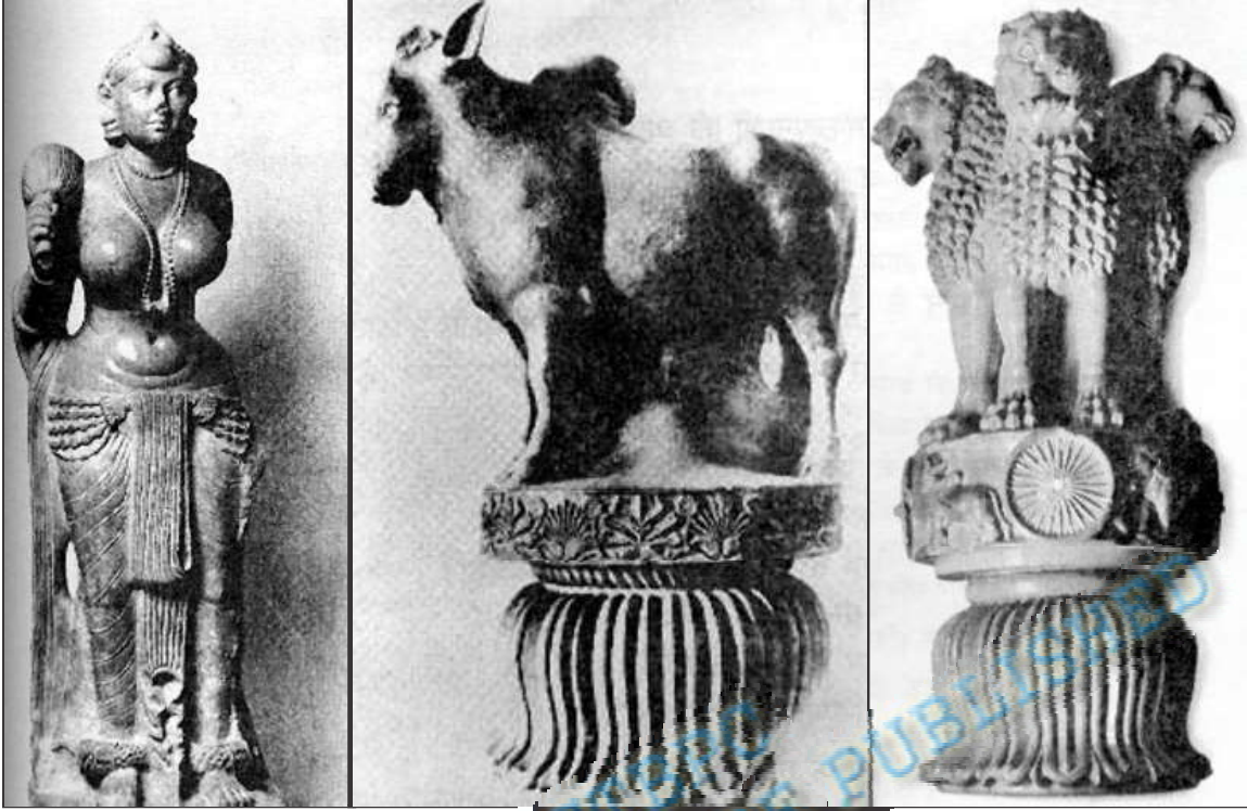
अशोक के शासनकाल की कुछ अन्य कलाकृतियाँ

बिहार के रामपुरवा में मिली अशोक स्तंभ का हिस्सा। अभी इसे राष्ट्रपति भवन में रखा गया है।