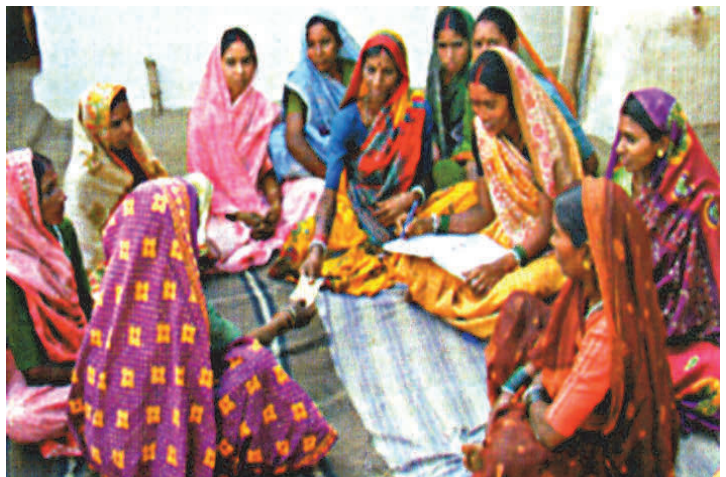
चित्र-8.4 स्वसहायता समूह की बैठक

किशन की माँ और भाभी ने किशन को समझाया और कहा, “बैलों को तो बेचने की जरूरत ही नहीं है और इतना कहकर वे मुस्कुराने लगीं।