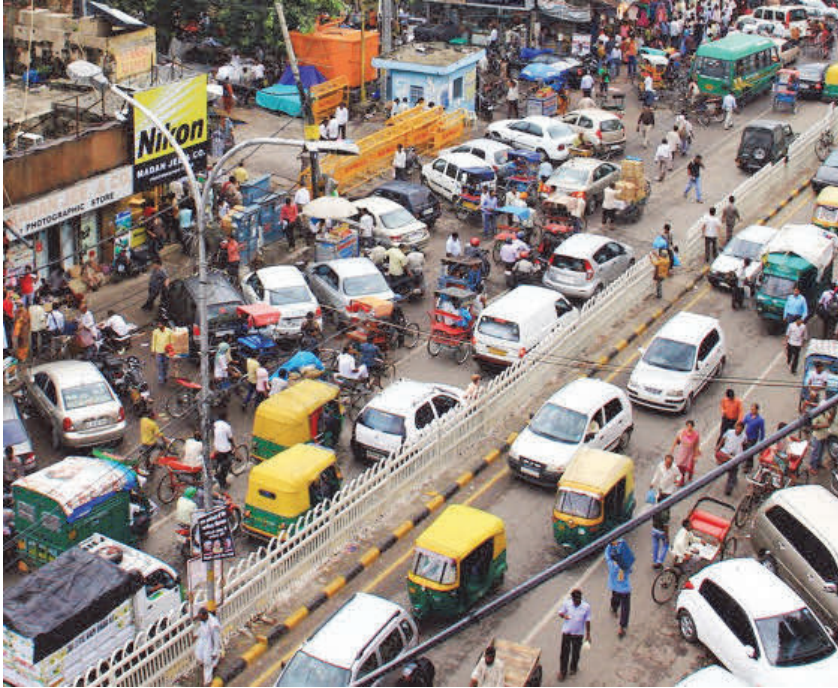
चित्र-8.1 अव्यवस्थित यातायात

विद्यालय जाते समय आपने परिवहन के विभिन्न साधनों जैसे साइकिल, रिक्शा, स्कूटर, मोटर साइकिल या कार, बस, ट्रक आदि को सड़क पर चलते देखा होगा। शहरों में वाहनों की अधिकता ने आवागमन को कठिन बना दिया है।