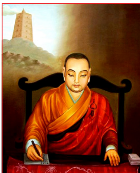
चित्र-10.3 चीनी बौद्ध यात्री

ह्वेनसांग भारत में 5 वर्षों तक रहा और वापस अपने देश जाकर उसने अपनी यात्रा का विवरण लिखा। वह कहता है कि भारत में उस वक्त बौद्ध धर्म उतना लोकप्रिय नहीं था जितना कि वह समझता था। ह्वेनसांग ने छत्तीसगढ़ की भी यात्रा की थी। उसने दक्षिण कोसल के मुख्य शहर सिरपुर (श्रीपुर) को उस समय के बौद्ध शिक्षा का प्रमुख केन्द्र बताया है।