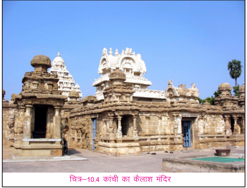
चित्र-10.4 कांची का कैलाश मंदिर

पल्लव राजा शुरु में जैन धर्म को मानते थे, मगर बाद में शिव व विष्णु के उपासक बन गए। उन्होंने अनेक मंदिर बनवाए। कुछ मंदिर पत्थर की विशाल शिलाओं को काट कर बनाए गए थे। महाबलिपुरम का रथ मंदिर इसका प्रमुख उदाहरण है। कुछ मंदिर पत्थरों की शिलाओं को जोड़कर बनाए जाते थे जैसे, कांची का कैलाश मंदिर। ये मंदिर केवल पूजा करने के स्थान ही नहीं थे बल्कि ये आसपास के लोगों के इकट्ठा होकर विचार-विमर्श करने, बच्चों को शिक्षा देने तथा उत्सव आदि मनाने के स्थान भी थे।