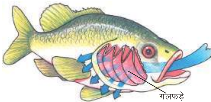
चित्र- 10.4 मछली के गलफड़े

क्या आप जानते हैं कि गाय, भैंस, साँप, छिपकली, पक्षी आदि में हमारी ही तरह फेफड़े प्रमुख श्वसन अंग हैं, किन्तु कुछ जन्तु ऐसे भी हैं जो गलफड़ों से श्वसन करते हैं। आपने देखा होगा कि मछली बार-बार मुँह खोलती और बन्द करती है। इनके मुँह के दोनों ओर ढक्कन होते हैं। इन ढक्कनों के भीतर लाल गलफड़े (गिल्स) दिखाई देते हैं, ये मछली के श्वसन अंग हैं (चित्र 10.4)। मुँह से भीतर आया पानी जब इनसे