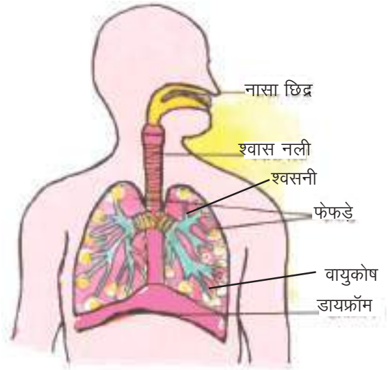
चित्र- 10.1 मनुष्य का श्वसन तंत्र

ऑक्सीजन युक्त वायु, नासिका गुहा से होती हुई श्वास नली में आती है। आगे जाकर श्वास नली दो भागों में बंट जाती है जिसे श्वसनी कहते हैं। फेफड़े एक गुहा में स्थित होते हैं जिसे वक्ष गुहा कहते हैं। आपने मधुमक्खी का छत्ता देखा होगा, उसमें अनेक कोष भी देखे होंगे। ठीक इसी प्रकार फेफड़ों में भी अनेक कोष पाये जाते हैं जिन्हें वायुकोष कहते हैं। इनकी दीवारें पतली झिल्ली की बनी होती हैं जिसमें पतली-पतली रक्त वाहिनियाँ होती हैं। श्वसनी के अन्तिम सिरे इन्हीं वायुकोषों में खुलते हैं। फेफड़ों के नीचे एक मांसल पट पाया जाता है जिसे डायफ्रॉम कहते हैं (चित्र-10.1)।