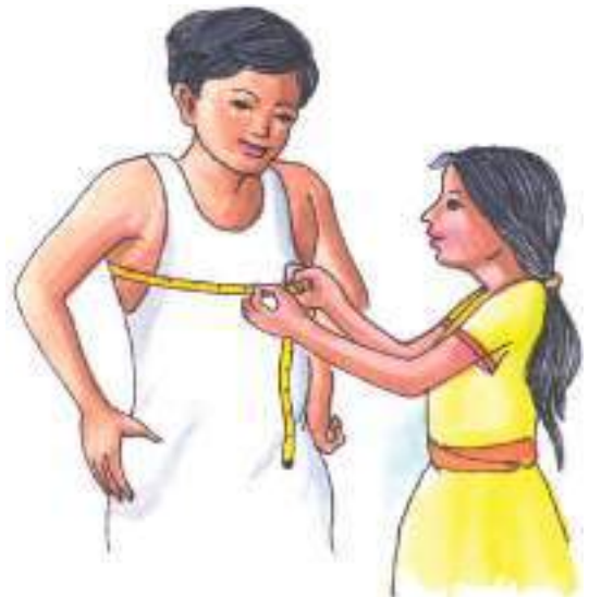
चित्र-10.2 सीने की माप लेना

उपर्युक्त प्रयोग के आधार पर आप समझ गए हैं कि जब हम श्वास लेते हैं तब वक्ष ऊपर उठता है तथा डायफ्रॉम नीचे होता है तब फेफड़े फैल जाते हैं। फेफड़ों में वायु का दाब कम हो जाता है तथा ऑक्सीजन युक्त वायु फेफड़ों में पहुँचती है (चित्र- 10.3क)। इसे अंतः श्वसन कहते हैं। श्वास छोड़ते समय वक्ष नीचे जाता है और डायफ्रॉम ऊपर उठता है फेफड़ों में वायु का दाब बढ़ जाता है और फेफड़े सिकुड़ते हैं। जिससे फेफड़ों में भरी कार्बन डाइऑक्साइड युक्त वायु बाहर निकल