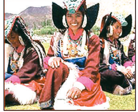
चित्र 10.6 : पारंपरिक वेशभूषा में लद्दाखी महिलाएँ

आधुनिकीकरण के फलस्वरूप यहाँ के जनजीवन में परिवर्तन आ रहा है। लेकिन लद्दाख के लोगों ने शताब्दियों से प्रकृति के साथ समन्वय एवं संतुलन करना सीखा है। जल एवं ईंधन जैसे संसाधनों की कमी के कारण ये आवश्यकतानुसार एवं मितव्ययिता से ही इनका उपयोग करते हैं और कुछ भी व्यर्थ नहीं करते।