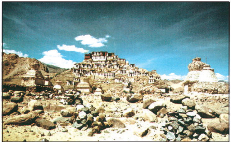
चित्र 10.5 : थिकसे मठ

ग्रीष्म ऋतु में यहाँ के निवासी जौ, आलू, मटर, सेम एवं शलजम की खेती करते हैं। शीत ऋतु में जलवायु इतनी कष्टकारी होती है कि लोग धार्मिक अनुष्ठानों एवं उत्सवों में अपने आपको व्यस्त रखते हैं। यहाँ की महिलाएँ अत्यधिक परिश्रमी होती हैं। वे केवल घर एवं खेतों में ही काम नहीं करती बल्कि छोटे व्यवसाय एवं दुकानें भी संभालती हैं। लद्दाख की राजधानी लेह, सड़क एवं वायुमार्ग द्वारा भलीभाँति जुड़ी हुई है। राष्ट्रीय राजमार्ग-1ए लेह को जोजीला दर्रा होते हुए कश्मीर घाटी से जोड़ता है। क्या आप हिमालय के कुछ अन्य दर्रा के बारे में बता सकते हैं?