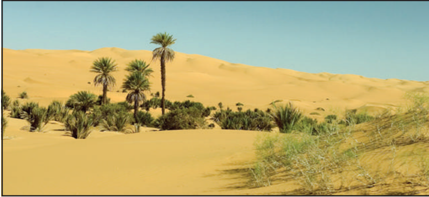
चित्र 10.3 : सहारा रेगिस्तान में मरूद्यान

ऊँट, लकड़बग्घा, सियार, लोमड़ी, बिच्छू, साँपों की विभिन्न जातियाँ एवं छिपकलियाँ यहाँ के प्रमुख जीव-जंतु हैं।