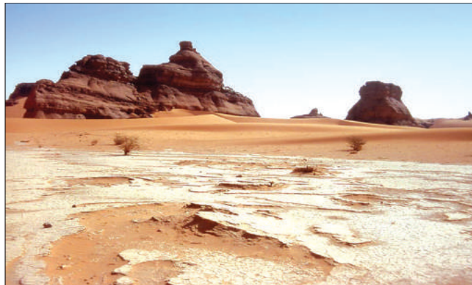
चित्र 10.1 : सहारा रेगिस्तान