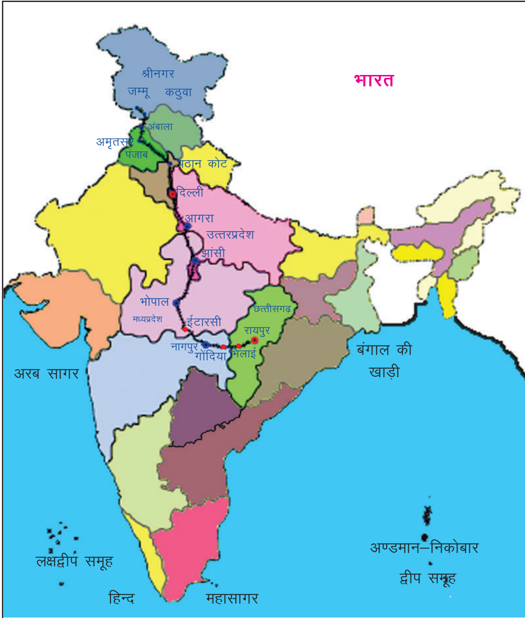
मानचित्र 1.3 बिलाई से जम्मू तक रेलमार्ग