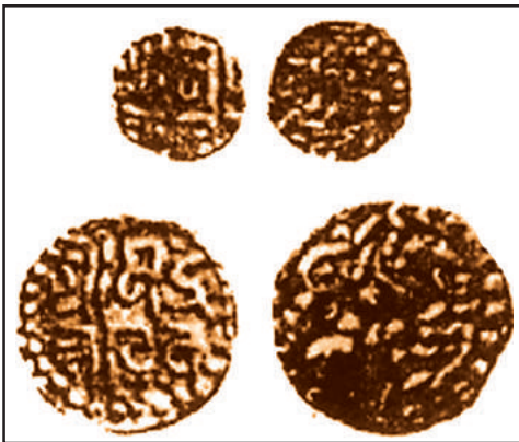
चित्र-1.2 रत्नदेव के शासन काल के सिक्के (12वीं सदी)

इस समय मध्य भारत में परमार वंश के राजाओं का शासन था। इस वंश के राजाओं में सबसे प्रसिद्ध था— राजा भोज। भोज ने सन् 1000 ई. से 1035 ई. तक शासन किया। अपनी शक्तिशाली सेना के कारण ही वह एक विशाल साम्राज्य की स्थापना करने में सफल हुआ था। भोज एक पराक्रमी राजा होने के साथ-साथ विज्ञान, साहित्य और वास्तुकला में भी गहरी रुचि रखता था।