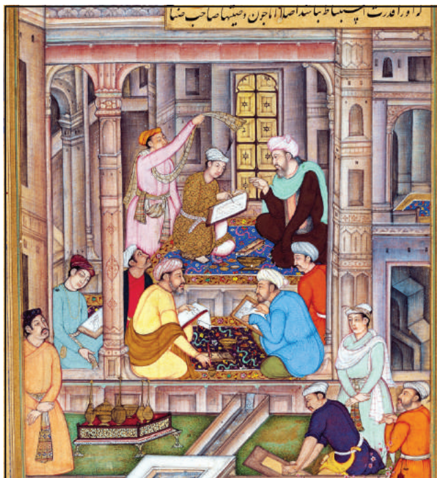
चित्र-6.3 अकबर एवं उनका दरबार