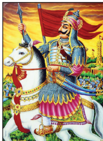
चित्र-6.4 राणा प्रताप

सन् 1576 में अकबर ने राणा प्रताप के खिलाफ राजा मानसिंह एवं राजकुमार सलीम के नेतृत्व में एक विशाल सेना चित्तौड़गढ़ भेजी। मुगल सेना और राणा प्रताप की सेना के बीच हल्दीघाटी में युद्ध हुआ। इस युद्ध में मुगल सेना विजयी हुई। किन्तु राणा प्रताप