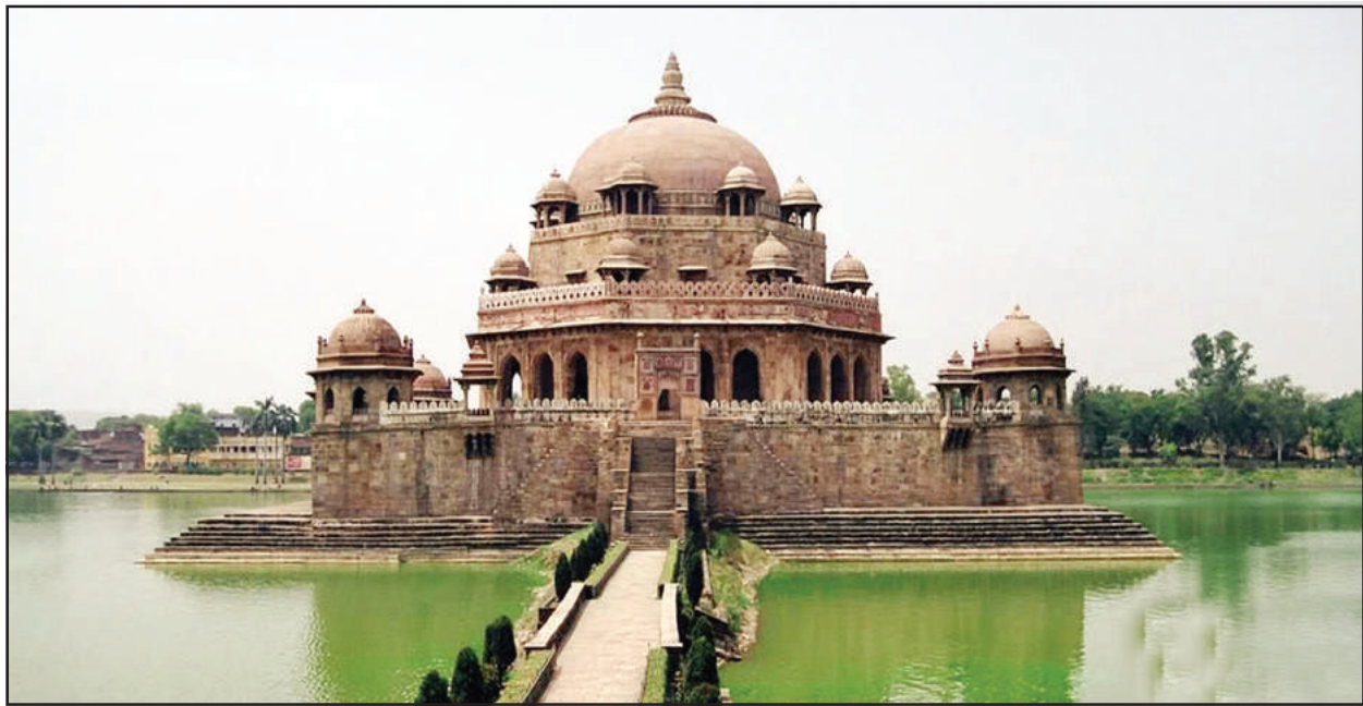
चित्र-6.2 शेरशाह सूरी का मकबरा, सासाराम, बिहार

आप यह जानते हैं कि हुमायूँ को बिहार के शेरशाह नाम के अफगान सरदार ने हराया और उसे भारत छोड़ने पर मजबूर कर दिया था। शेरशाह एक अफगान सरदार का पुत्र था। बिहार के सासाराम में उसकी छोटी-सी जागीर थी। उसने कई छोटे-बड़े राजपूत और अफगान सरदारों को हराया।