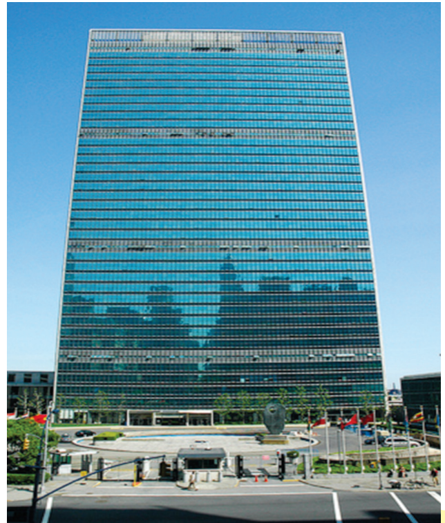
संयुक्त राष्ट्र संघ का कार्यालय (न्यूयार्क)