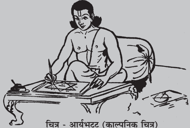
चित्र - आर्यभट्ट (काल्पनिक चित्र)

घूमते हुए लट्टू को हम सभी ने देखा है। हमारी पृथ्वी भी किसी लट्टू की तरह ही घूमती है। पृथ्वी के इस गति के बारे में करीबन 1400 साल पूर्व भारत के विख्यात ज्योतिषशास्त्रवेत्ता तथा महान गणितज्ञ आर्यभट्ट (प्रथम) ने संभवतः पहली बार व्यक्त किया। गणितशास्त्र तथा ज्योतिषशास्त्र के संबंध में उन्होंने आर्य सिद्धांत नाम का ग्रंथ लिखा। इस ग्रंथ में गणित तथा ज्योतिष विषय के सिद्धांत सूत्रबद्ध व श्लोकबद्ध पद्धति से दिए हैं। बड़े-बड़े अंकों को संक्षेप में लिखने की अभिनव पद्धति इस ग्रंथ में दी गई है। इसके अलावा राशि व अंश के परस्पर संबंध, युग पद्धति, आकाश का विस्तार, पृथ्वी, सूर्य, चन्द्र व ग्रह की गतियाँ, अंतर मापने के छोटे-बड़े पैमाने आदि जानकारी इस ग्रंथ में है।