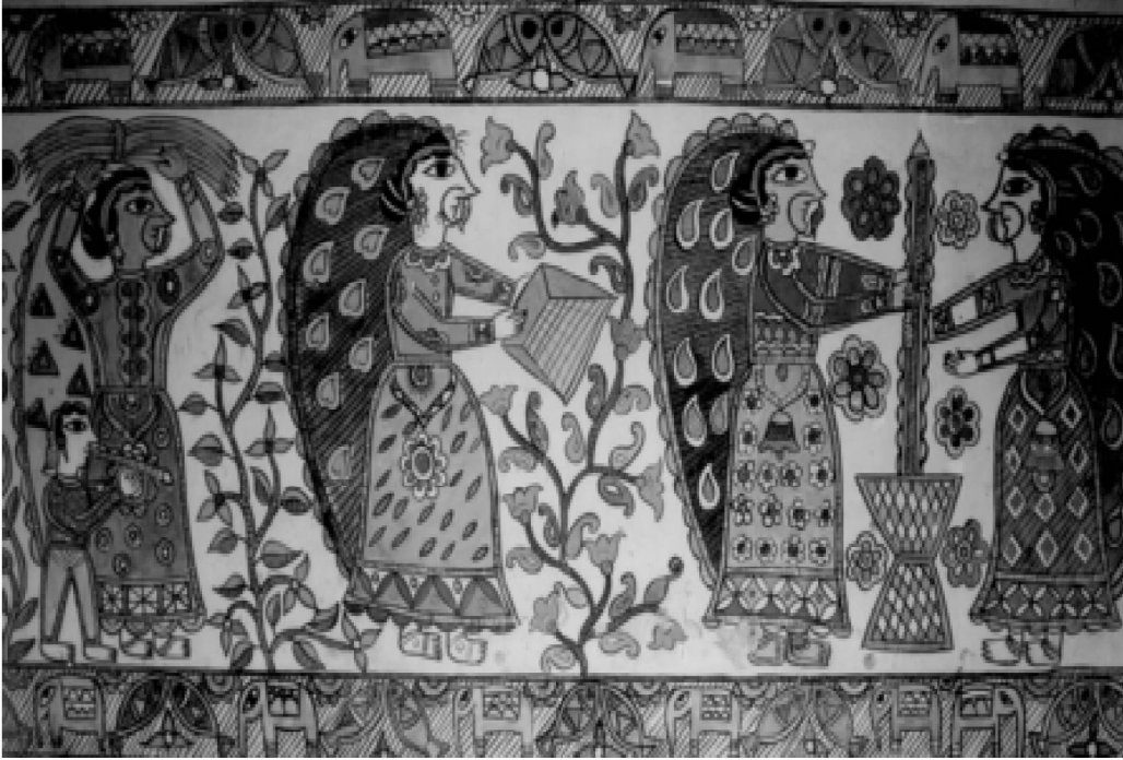
मिथिला लोकचित्र