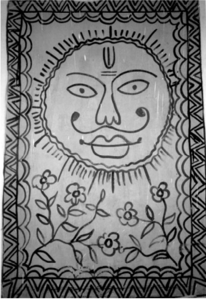
मिथिला लोकचित्र

लोक संस्कृति में पढ़े-लिखे सभ्रांत पुरुष वर्ग की अपेक्षा महिला समाज तथा विद्वता-विशेषज्ञता से दूर जनसामान्य का महत्त्व अधिक हुआ करता है। मिथिला की चित्रकला में भी महिला वर्ग की प्रधानता निर्विवाद रही है परंतु पढ़े-लिखे कलाप्रेमी जनों के प्रभाव ने प्रसिद्धि देने के साथ ही उसमें अनेक परिष्कार भी पैदा किये हैं। कभी मात्र जमीन, भित्ति और कपड़े तक सीमित इस चित्रकारी