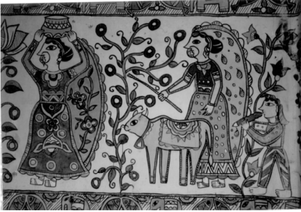
मिथिला लोकचित्र

भूमि आकल्पन : भूमि आकल्पन की परंपरा प्रायः हर संस्कृति में रही है। महाराष्ट्र की रंगोली, गुजरात की साँथिया उत्तर प्रदेश के ब्रज क्षेत्र की साँझी, पहाड़ी क्षेत्र की आँजी, राजस्थान की माँडना, दक्षिणी प्रदेशों का ओलम, असम की अल्पन आदि भूमि आकल्पना के ही विभिन्न रूप हैं। बिहार में इसे चौका पूरना कहा जाता है जो पूजा-पाठ के समय कलश स्थापन की जगह अनिवार्य होता है। इसे ही मिथिला में आश्विन या अरिपन कहा जाता है। यह अरिपन मिथिला में भी किसी पूजा, उत्सव या अनुष्ठान अथवा विवाह जैसे मांगलिक अवसर का भूमि चित्र हुआ करता है। विवाह के समय के अरिपन में कमल, मछली, पुरइन (कमल का पत्ता), बाँस आदि के चित्र बनाये जाते हैं।