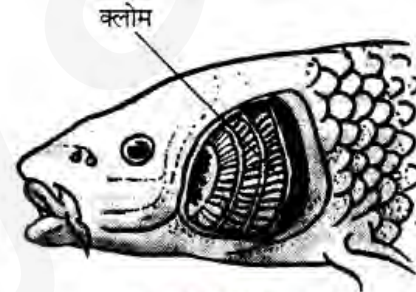
मछलियों में श्वसन अंग